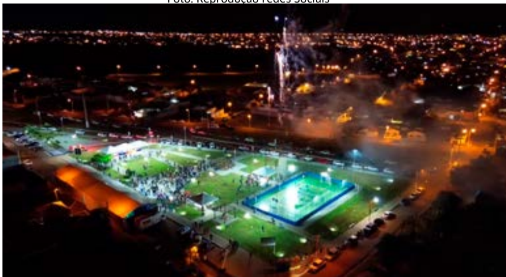
Vista aérea noturna da Praça Dário Garibaldi Guimarães, durante ato inaugural