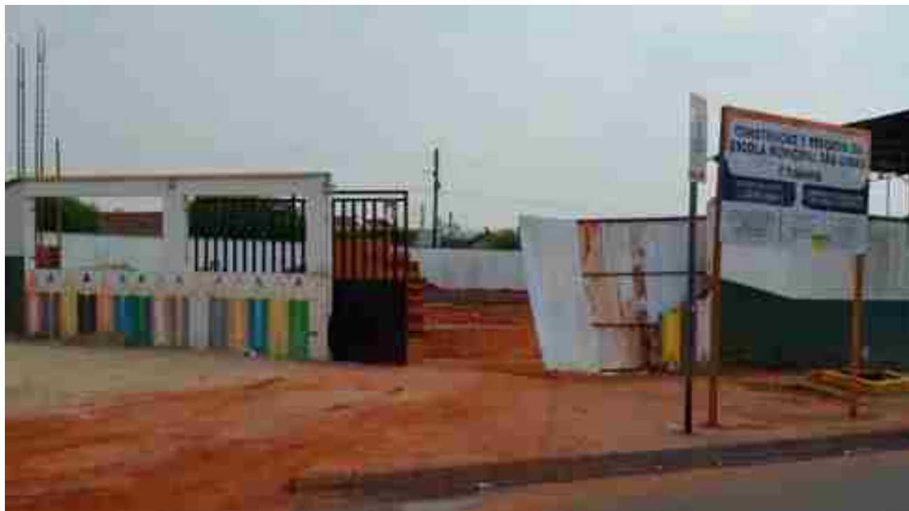
Reconstruída com recursos próprios do município, obra tem investimento pouco superior a R$ 1,2 milhão

A Escola Municipal São Dimas localizada no bairro com o mesmo nome, funcionou por cerca de 39 anos em um prédio construído com placas de ci-