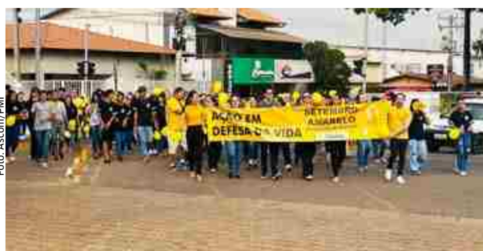
Setembro Amarelo movimentou profissionais da saúde e pessoas da comunidade em Itaberaí

tral de Itaberaí, finalizando em frente à Prefeitura Municipal e lives com Digitais Influencers do município, debatendo temas relacionados à saúde mental, ações nas UBSs e entrevistas nas Rádios Cultura e Silvestre FM. Você é importante! Vamos juntos em defesa da vida!