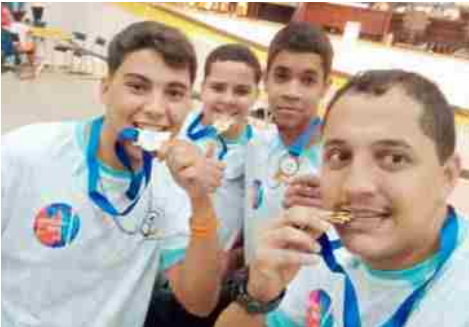
Alunos se destacam entre estudantes de robótica de escolas públicas e particulares do Brasil