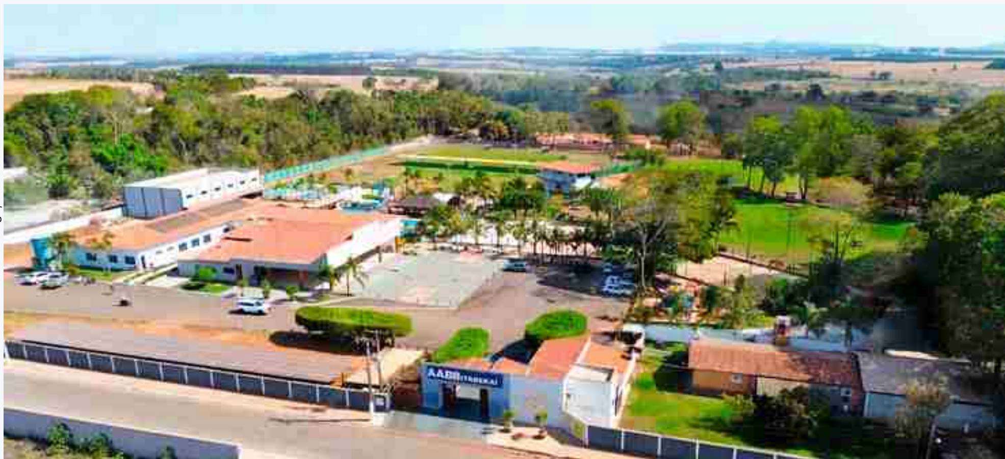
O clube da AABB Itaberaí funciona de segunda a sexta-feira, das 5h às 22h. Aos sábados, domingos e feriados, das 8h às 18h.

O clube da AABB (Associação Atlética Banco do Brasil), de Itaberaí é um dos melhores clubes de lazer do interior de Goiás e figura entre os principais clubes da AABB no Brasil.