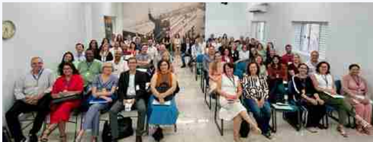
Sede da Fundação Logosófica em Itaberaí completa 25 anos de instalação

Como cultores dessa Ciência, ao nos tornar mais conscientes de que fazemos parte de um Sistema de Vinculação Espiritual, criado especialmente para que todos, em estreita união, possamos contrapor-nos ao mal no qual se encontra submersa a humanidade, buscando atender mais e com maior responsabilidade esse chamado íntimo, para o qual nos despertou o estudo logosófico, experimentamos um estímulo vibrante em nossos