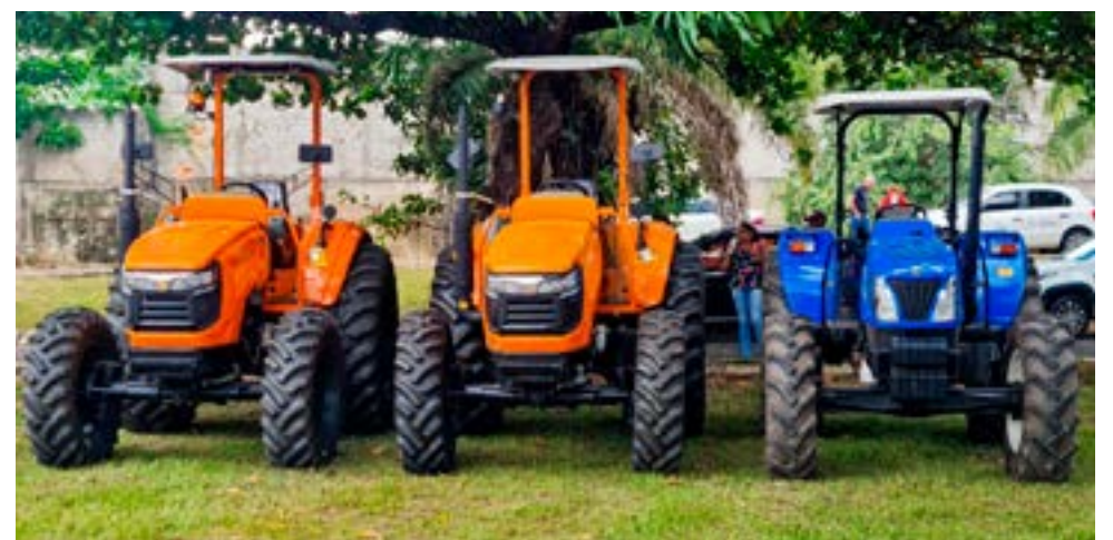
Equipamentos já estão sendo utilizados nos assentamentos rurais

A Prefeitura de Goiás entregou equipamentos agrícolas para assentamentos rurais do município. São tratores, ensila-