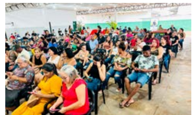
Prefeitura promove reunião para detalhar auxílio moradia

Na última terça-feira, 26, a prefeitura reuniu beneficiários do programa, representantes da Caixa, vereadores e servidores para sanar dúvidas e entregar os cartões de benefícios para 200 famílias atendidas.