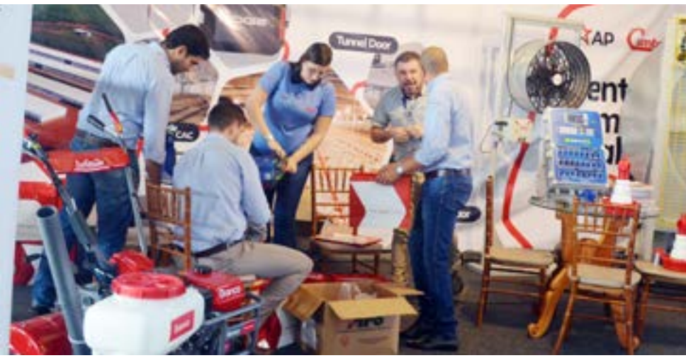
A AABB recebeu cerca de 400 produtores rurais para capacitação e fechamento de negócios

Na sexta-feira, dia 22, aproximadamente 400 produtores rurais estiveram presentes na sede da Associação Atlética do Banco do Brasil (AABB) em Itaberaí, para vivenciar um dia de capacitação, troca de experiências e oportunidades de negócios. A 1ª Feira de Avicultura de Itaberaí contou com grande apoio da São Salvador Alimentos (SSA) que, além de auxiliar em parte da infraestrutura do evento, foi fundamental para promover a presença dos avicultores, integrados ao frigorífico.