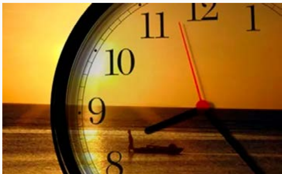
Criado em 1931, o horário de verão foi extinto no governo de Jair Bolsonaro, em 2019

O ministro de Minas e Energia, Alexandre Silveira, disse nesta quarta-feira (27) que não há sinais de que será necessário adotar o horário de verão em 2023. Segundo ele, os reservatórios das usinas hidrelétricas estão na melhor condição de armazenamento de água dos últimos anos. "O Horário de Verão só acontecerá se houver sinais e evidências de uma necessidade de segurança de suprimento do setor elétrico brasileiro. Por enquanto, não há sinal nenhum nesse sentido. Estamos com os reservatórios no melhor momento dos últimos 10 anos", explicou Silveira em entrevista no Palácio do Planalto. Segundo ele, o governo avalia, em algumas regiões específicas, a necessidade