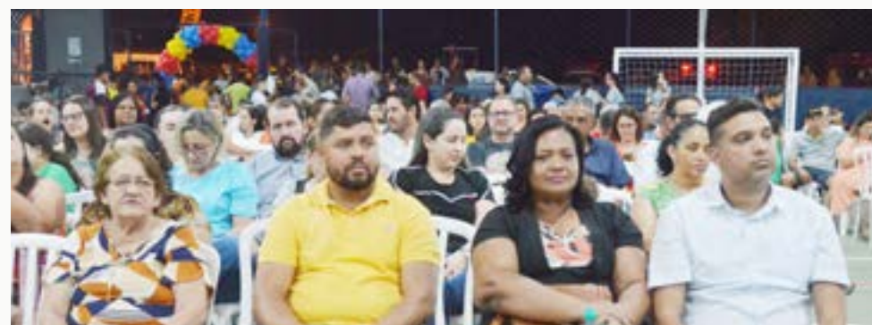
Comunidade local prestigia a entrega de três importantes benefícios para o Distrito de São Benedito, em Itaberaí

Fique em dia com o progresso de nossa Cidade!