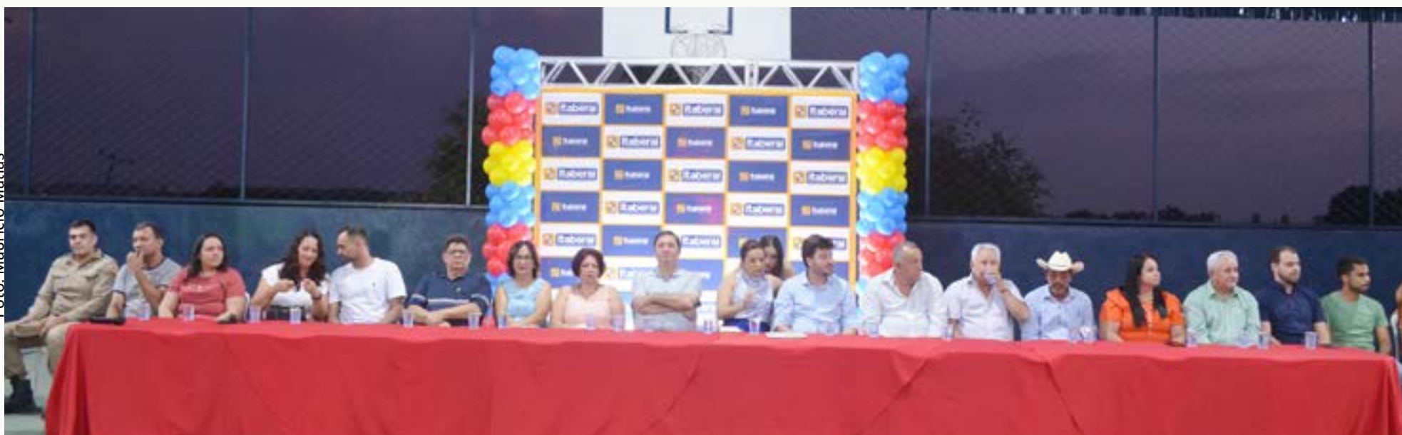
Evento realizado em São Benedito reuniu lideranças e autoridades locais, com presença do deputado estadual Wagner Neto

A Prefeitura de Itaberaí reafirma seu compromisso em promover melhorias significativas na qualidade de vida de sua população por meio de investimentos substanciais em projetos de infraestrutura, saúde e educação. Essas ações refletem o desejo da