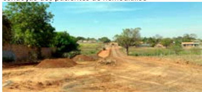
Pavimentação asfáltica do Setor Cidade Livre