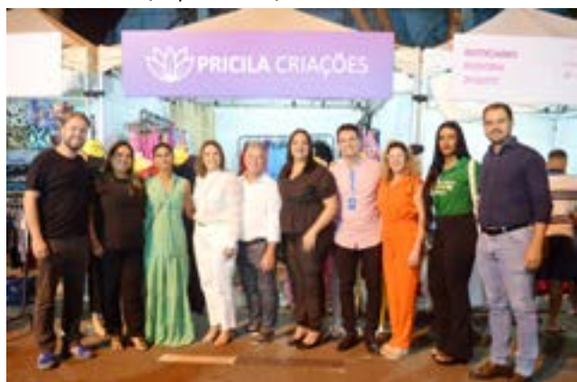
Visita técnica aos expositores