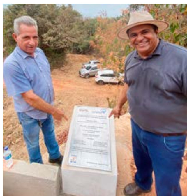
Inauguração da ponte da marreca distrito Jacilândia