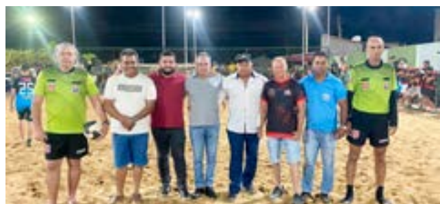
2º torneio de futebol de areia