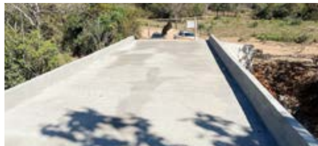
Ponte de concreto da Marreca - Distrito Jacilândia (depois)