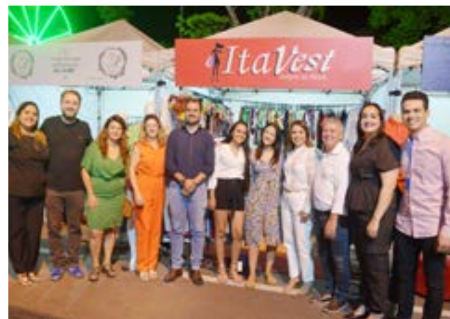
Visita técnica aos expositores