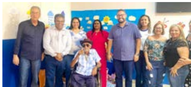
Inauguração da reforma e ampliação da Escola Sebastiana Sardinha da Costa