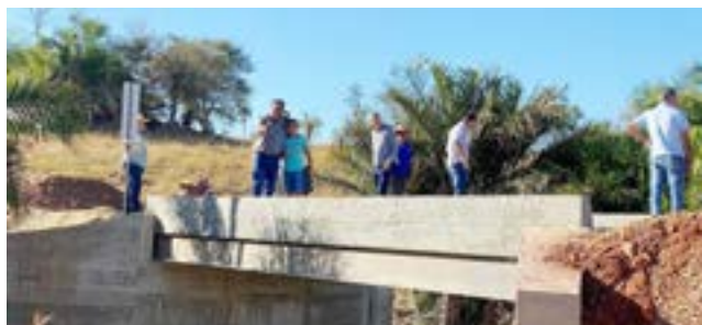
Ponte do Córrego Engano - região Anta Morta