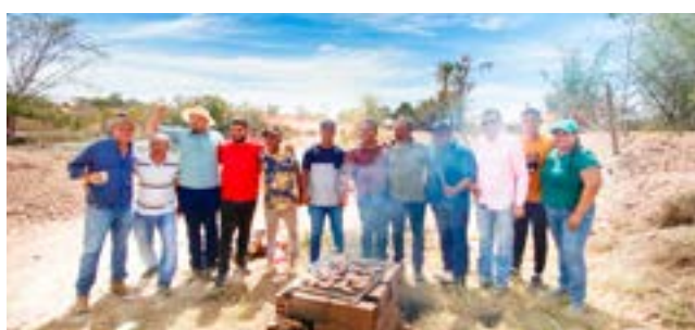
Inauguração do aterro e bueiro da região do brejo