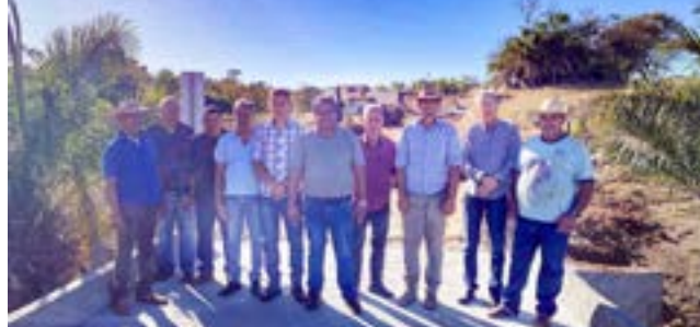
Ponte de concreto Córrego Engano - região Anta Morta