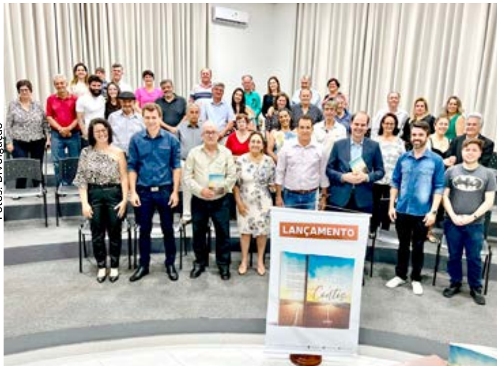
Amigos e familiares também prestigiaram o autor