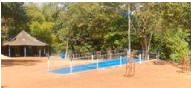
Rampa do Beira Rio e cerca ornamental