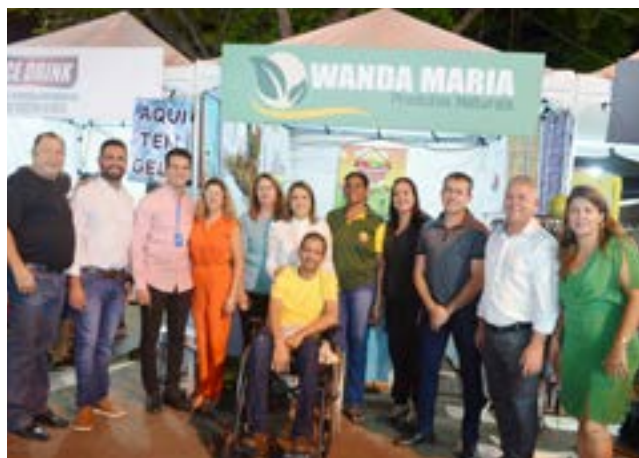
Visita técnica aos expositores