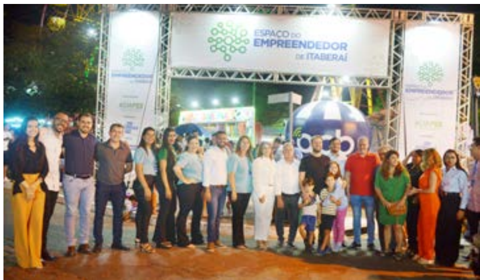
Portal de entrada da 2ª edição do Espaço do Empreendedor de Itaberaí

A ACIAPI - Associação Comercial, Industrial e Agropecuária de Itaberaí, realizou a 2ª edição do “Espaço do Empreendedor de Itaberaí”. Durante os 10 dias do evento (06 a 15 de agosto de 2023), 44 empreendedores e negócios de Itaberaí, divulgaram e comercializaram seus produtos e serviços em uma oportunidade ímpar de interação presencial com o público de Itaberaí e região.