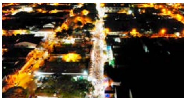
Vista aérea do Espaço do Empreendedor de Itaberaí