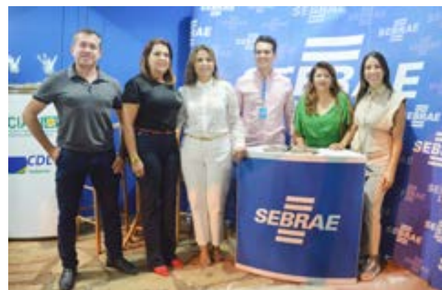
Visita à 2ª edição do Espaço do Empreendedor de Itaberaí