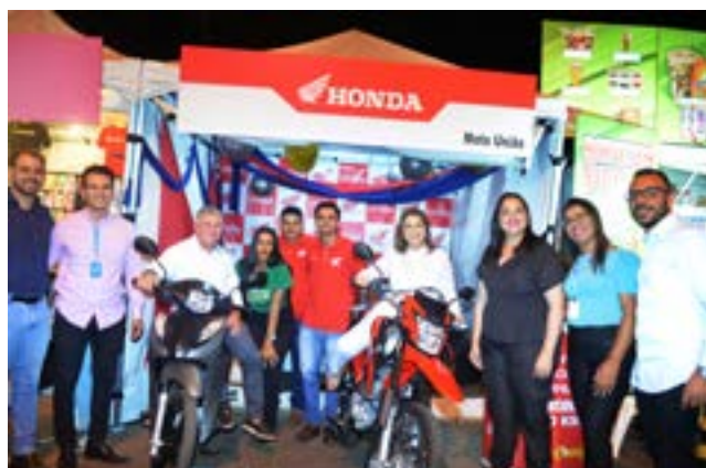
Visita técnica aos expositores