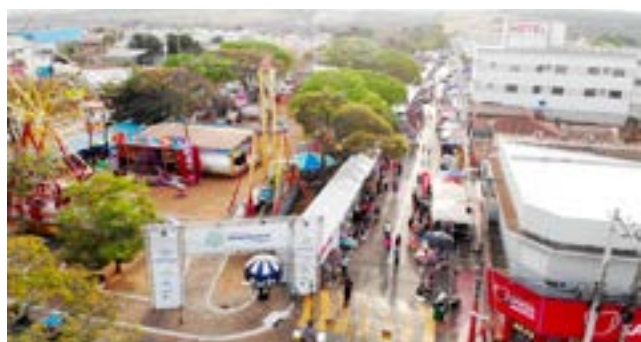
Vista aérea do Espaço do Empreendedor de Itaberaí