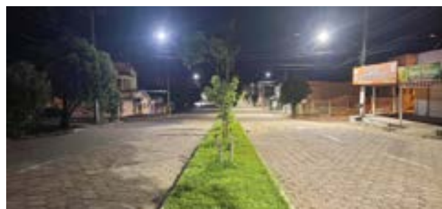
Iluminação das avenidas duplas do município