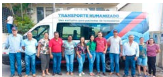
Transporte humanizado: doação de uma van Okm para condução dos pacientes de hemodiálise

vivência, CRAS, apoio técnico e profissional para assegurar os usuários ao Benefício de Prestação Continuada BPC, inúmeras famílias em situação de vulnerabilidade social assistidas com cestas básicas e kit de higiene pessoal. Na saúde, destacamos os investimentos que foram em aquisição de uma van Okm para os pacientes usuários de hemodiálise, um raio x moderno de última geração, troca de equipamentos no Hospital Municipal, uma ambulância Semi-UTI. É mais saúde, esporte, lazer, e acima de tudo, mais dignidade para nossa gente, temos diversos projetos em andamento e parcerias em construção. Estamos buscando constantemente recursos junto ao governo estadual e federal para promover melhorias em nosso município, diminuir as desigualdades sociais, com organização da gestão, responsabilidade e transparência. Sabemos que temos muito por fazer, sabemos dos desafios que devemos enfrentar, mas estamos preparados, determinados e confiantes que estamos fazendo a diferença.