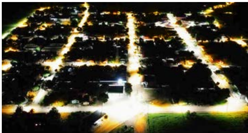
Iluminação Distrito de Jacilândia

Fortalecer o desenvolvimento de nossa cidade e seguir cuidando de nosso povo, foi com esse compromisso que assumimos a Prefeitura de Itapirapuã em 2021, e por ele, temos trabalhado incansavelmente esses 1000 dias de governo. Surgiram muitos obstáculos, principalmente com uma pandemia que assolou o mundo todo, depois uma crise econômica que diminuiu o repasse do ICMS pelos Estados. Mas, encaramos os desafios de frente, e com participação de uma gestão unida, estamos fazendo nossa cidade avançar. Na hora certa tomamos medidas firmes, como redução de gastos públicos e a recomposição da capacidade de investimentos do município. Fomos em busca de recursos e conse-