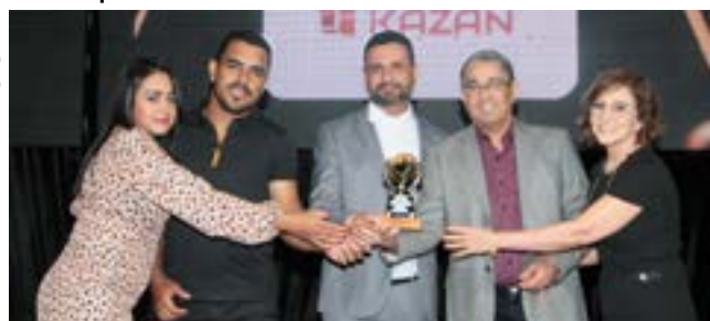
Lojas de Presentes e Decorações: Lojas Kazan