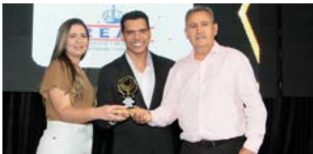
Funerária: Real Serviços Funerários