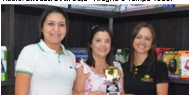
Revenda de Celulares: Primecell