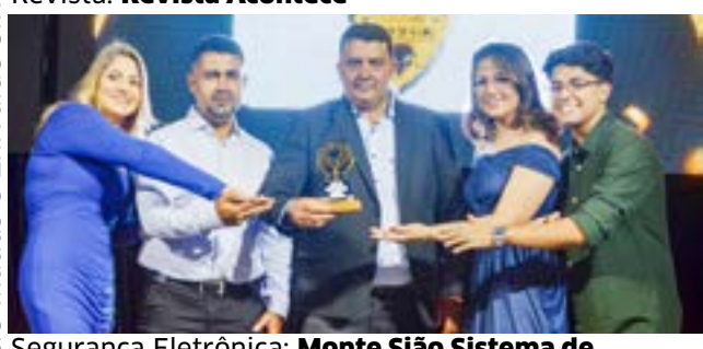
Segurança Eletrônica: Monte São Sistema de Segurança