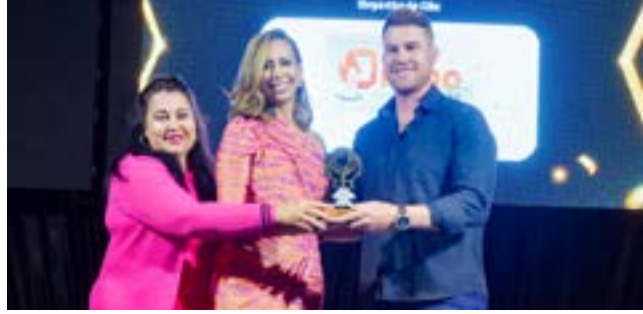
Depósito de Gás: Divino Gás