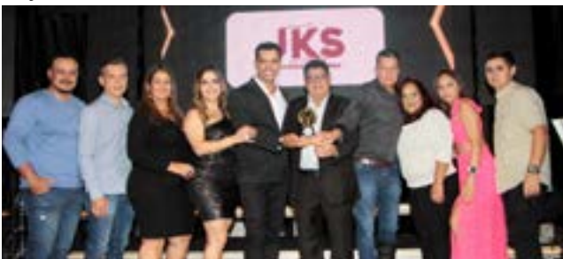
Marmoraria: JKS Mármore e Cubas