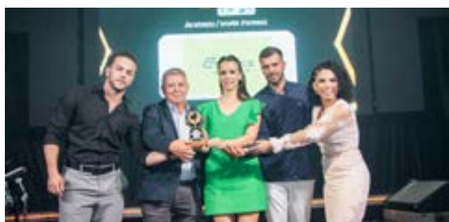
Academia e Studio Personal: Essece GYN