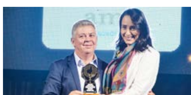
Centro Clínico Médico: AMA Diagnóstico