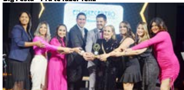
Clínica de Estética Corporal: Emagrecentro