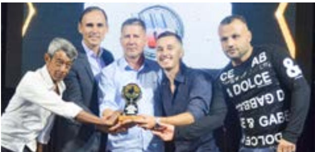
Industria de Moveis Planejados: Weber Art Moveis