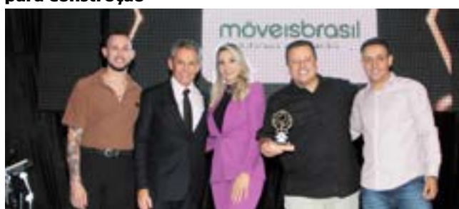
Loja de Móveis e Eletrodomésticos: Móveis Brasil - Tudo que sua Casa Precisa