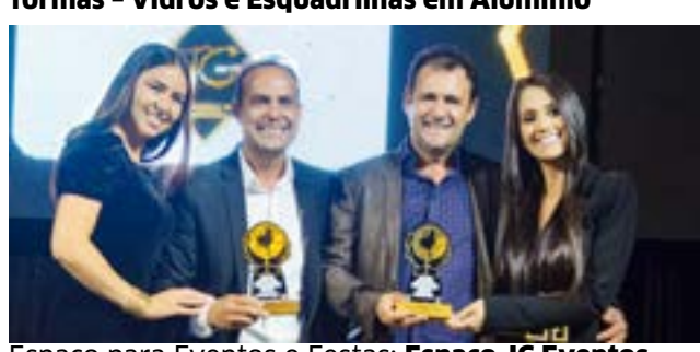
Espaço para Eventos e Festas: Espaço JG Eventos - Buffet