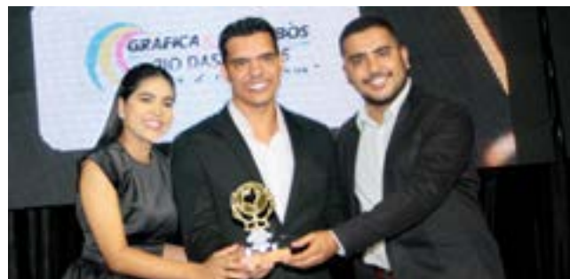
Gráfica: Gráfica e Carimbo Rio das Pedras