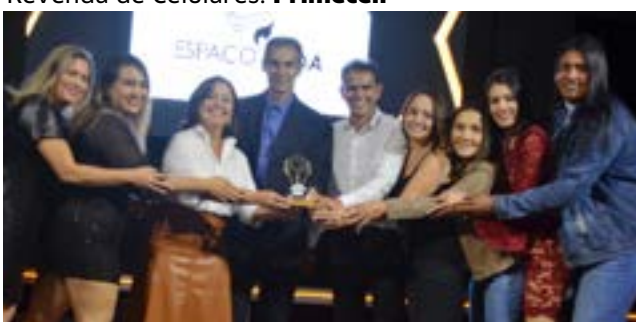
Salão de Beleza Feminina: Espaço Linda