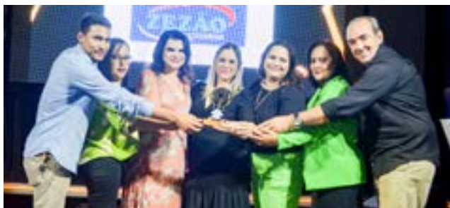
Peças e Acessórios Para Caminhões: Zeção Peças e Acessórios