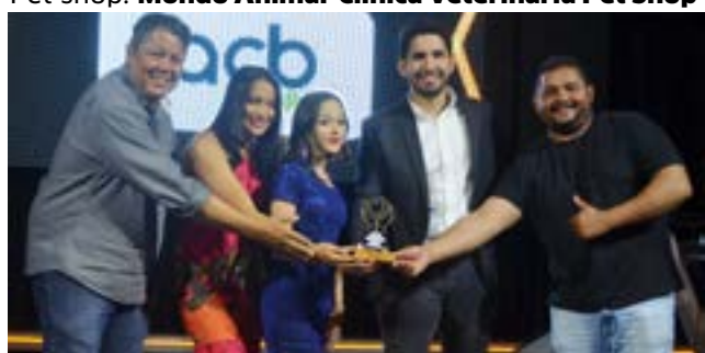
Provedor de Internet: ACB Fibra