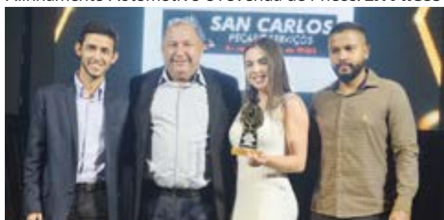
Auto Peças para Veículos: San Carlos - Peças e Serviços