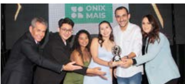
Consultoria Empresarial: Ônix Mais