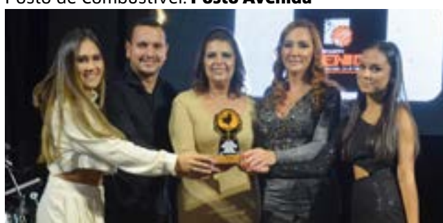
Restaurante: Restaurante Avenida