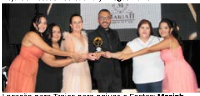
Locação para Trajes para noivas e Festas: Mariah Loções de Trajes