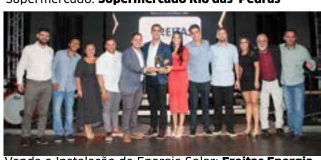
Venda e Instalação de Energia Solar: Freitas Energia Solar