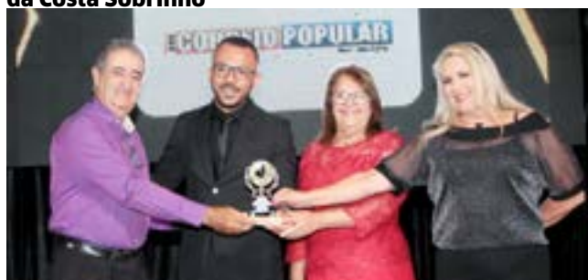
Jornal Impresso: Correio Popular