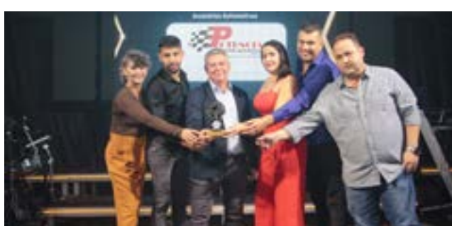
Acessórios Automotivos: Potência Centro Automotivo