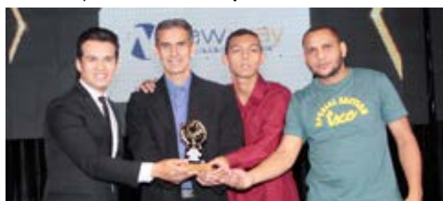
Assistências Técnica em informática: New way-Informática, Educação e Serviço