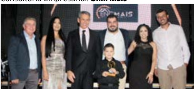
Projetos de Engenharia Civil-Engenheiro: Engmais