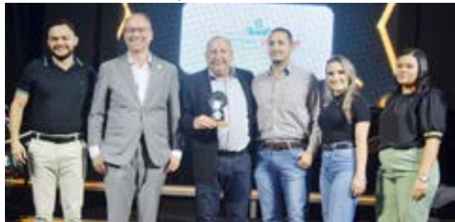
Clínica Odontológica: Centro Clínico Pró Sorrir