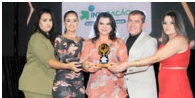
Papelaria: Interacção Papelaria e Brinquedos