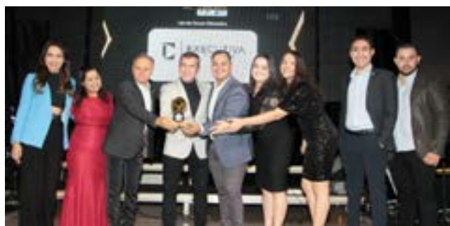
Industria de Confeccões: Executiva Mens Wer