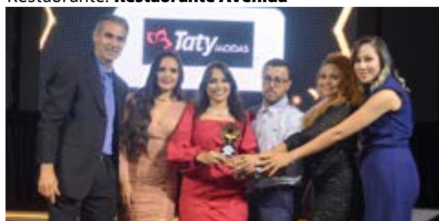
Loja de Roupas Feminina: Taty Modas