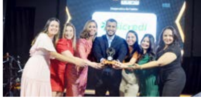
Cooperativa de Crédito: SICREDI