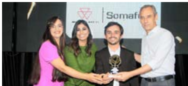
Máquinas Agrícolas Peças e Serviços: Somafertil - Massey Ferguson