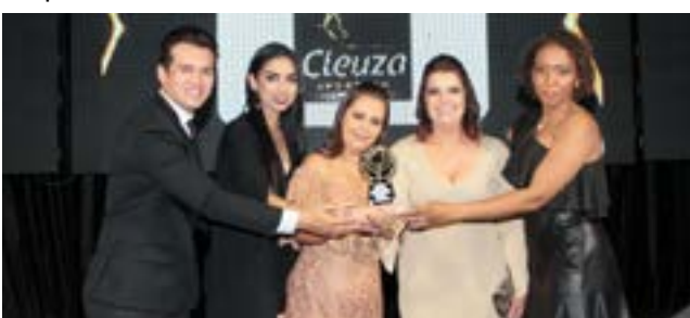
Loja de Produtos Sensuais e Acessórios: Cleuza Showroom-Você em Evidência