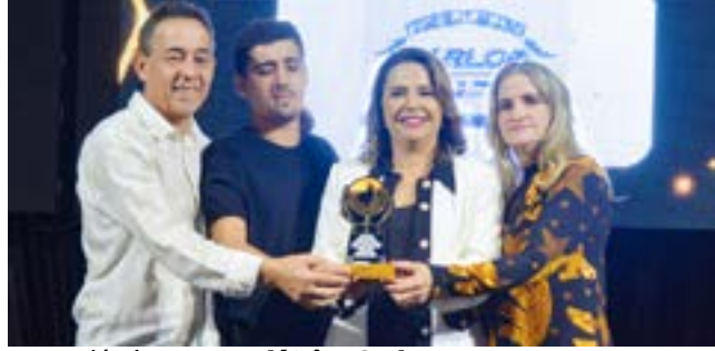
Auto Elétrica: Auto Elétrica Carlos