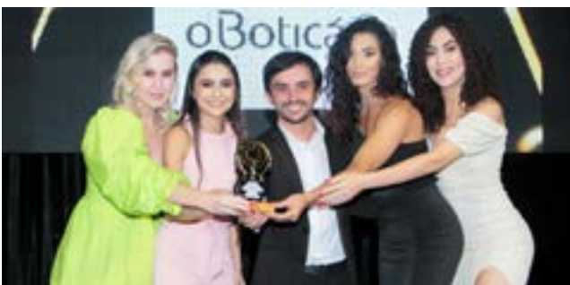
Perfumaria: O Boticário