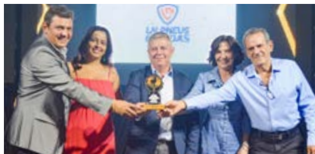
Alinhamento Automotivo e revenda de Pneus: LN Pneus