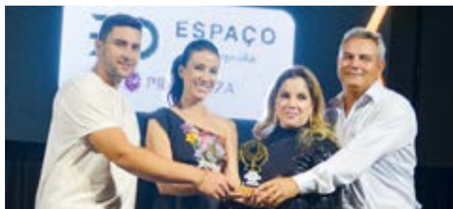
Persianas Cortinas e Decorações: Espaço Decoração e Provanza