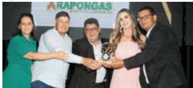
Madeiraira: Arapongas Madeiras e Transportes