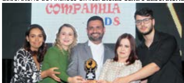
Loja de Roupas Infantil: Companhia Kids