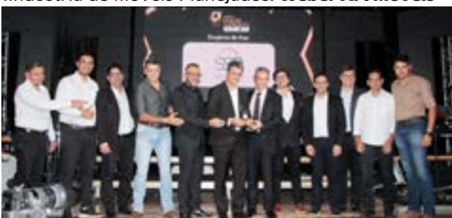
Empresa do Ano: São Salvador Alimentos-SSA