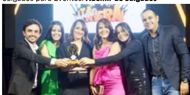
Site de Notícias e Eventos: Portal de Itaberal