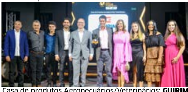
Casa de produtos Agropecuários/Veterinários: GUIRIM - tudo para agropecuária