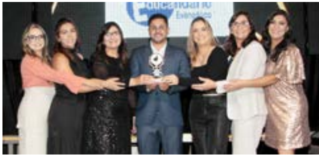
Escola particular: Educandário Evangélico