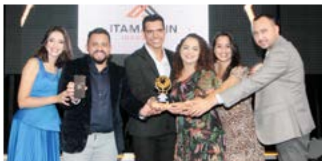
Imobiliária: Itamarzín Imobiliária