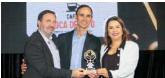
Industria de Café: Café Boca de Pito - Presente em Todos os Momentos