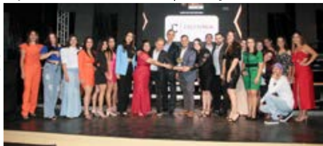
Loja de Roupas Masculinas: Executiva Mens Wer