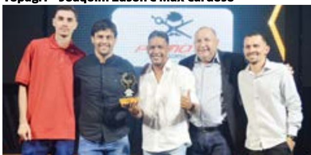
Barbearia: Primos Barbearia