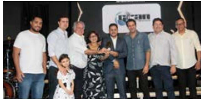
Escritório Contábil: Gran Contabilidade