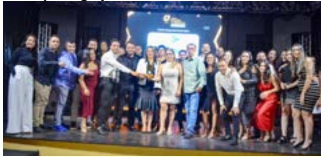
Crédito Consignado e Empréstimo: Grupo 3 RN