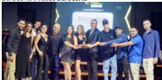
Comunicação Visual: Plotoarte