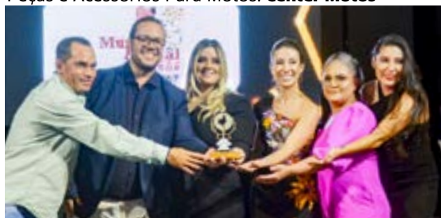
Pet shop: Mundo Animal-Clinica Veterinária Pet Shop