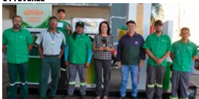
Posto de Combustível: Posto Avenida