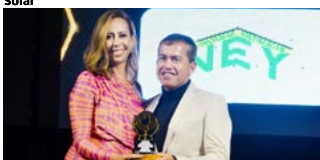
Estruturas Metálicas: Estruturas Metálicas Ney