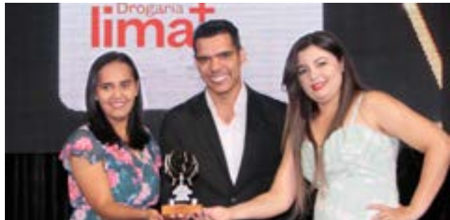
Farmácia e Drograria: Drograria Lima