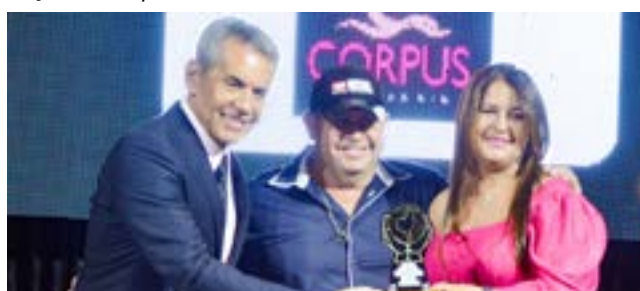
Loja de Moda Praia e Aeróbica: Corpos Moda Praia