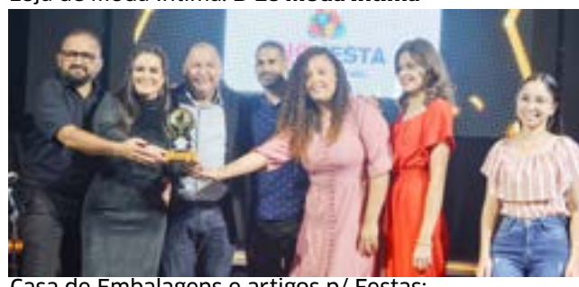
Casa de Embalagens e artigos p/ Festas: Big Festa - Pra te fazer feliz