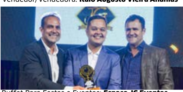
Buffet Para Festas e Eventos: Espaço JG Eventos - Bufft