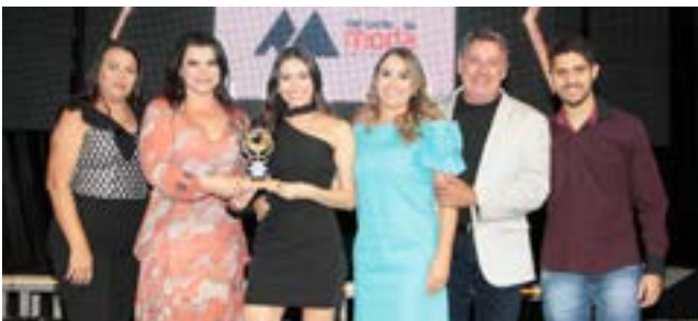
Loja de Cama, Mesa e Banho e Enxoval: Mercadão da Moda