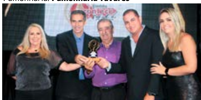
Revista: Revista Acontece