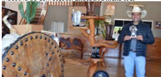
Loja de Acessórios Country: Vegas Ranch