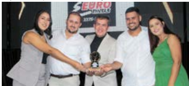
Loja de Tinta Automotivas e Residencial: Euro Tintas