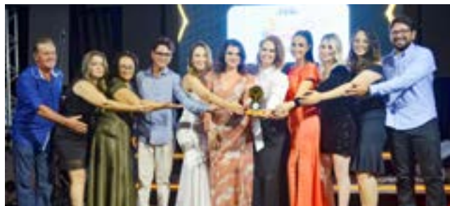
Revenda de Óleos Essenciais: Equipe Criadas Para Cuidar