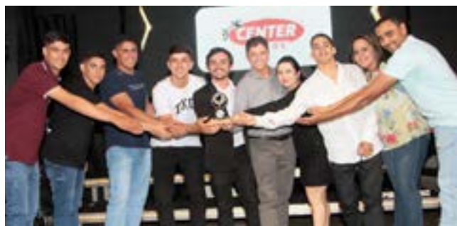
Peças e Acessórios Para Motos: Center Motos