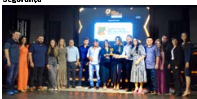
Supermercado: Supermercado Rio das Pedras