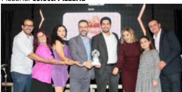
Rádio: Silvestre FM 91,1 - Alegria o Tempo Todo!