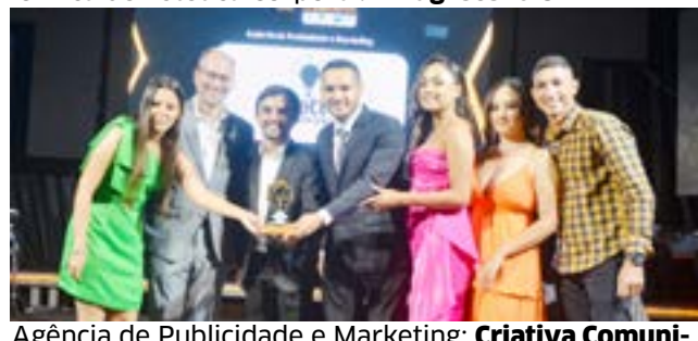
Agência de Publicidade e Marketing: Criativa Comunicação