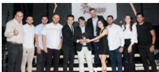
Loja de Matérias para Construção: Ratinho Materiais para Construção