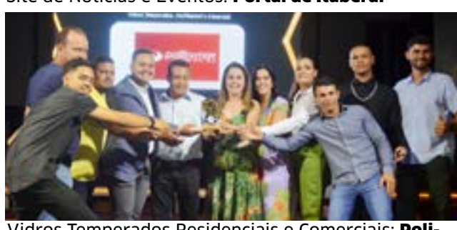
Vidros Temperados Residenciais e Comerciais: Poli-formas - Vidros e Esquadilhas em Alumínio