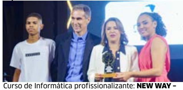
Curso de Informática profissionalizante: NEW WAY - Informática Educação e Serviços