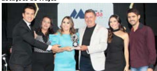
Loja de Calçados Masculinos: Mercadão da Moda