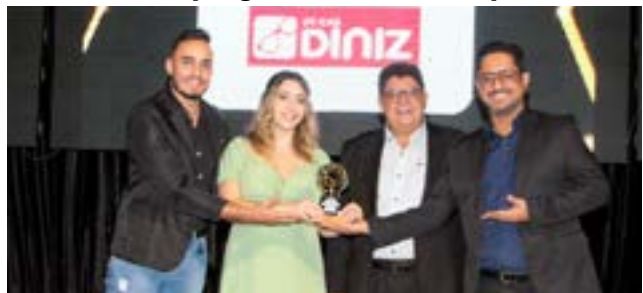
Ótica: Ótica Diniz