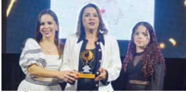
Doces finos e personalizados: Lide Doces