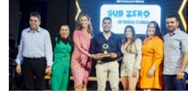
Distribuidora de Bebidas: Sub Zero Distribuidora de Bebidas