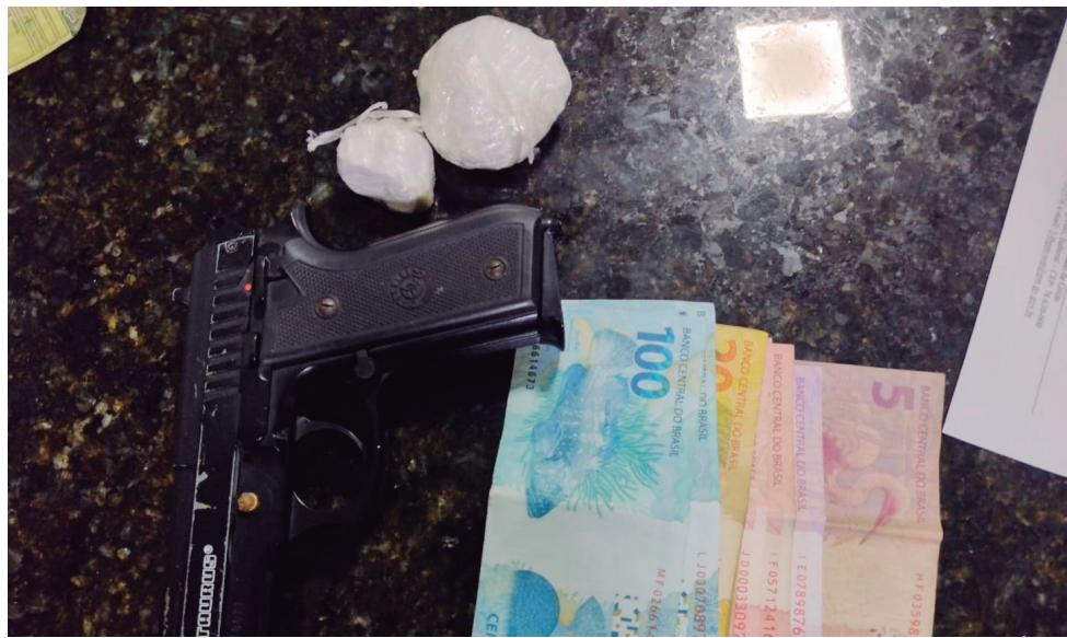
Dinheiro, simulacro de arma de fogo e drogas apreendidos pelos policiais

No início da noite do último dia 24, as equipes do CPU e da Barreira de Fiscalização do Município de Goiás (2º BPMRV), durante abordagem decorrente de uma operação policial na Rodovia GO-154, na altura do quilômetro 115, no Município de Taquaral-GO, visualizaram quando veio até próximo ao bloqueio policial uma motocicleta e retornou rapidamente.