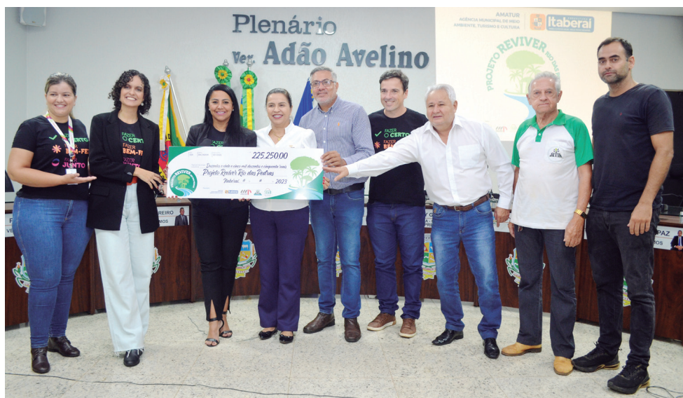
São Salvador Alimentos já investiu mais de R$ 225 mil na preservação do Rio das Pedras

A Prefeitura de Itaberaí, através da Agência Municipal de Meio Ambiente, Turismo e Cultura (AMATUR), celebra passo importante na continuidade do projeto de ações am-