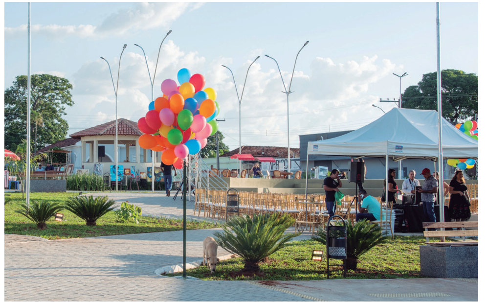
Praça Sinhô Pinheiro minutos antes da reinuguração