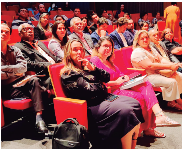
Evento reuniu autoridades, empresários do setor e comunidade

O Plano Municipal de Turismo da Cidade de Goiás para os próximos 10 anos foi apresentado pela gestão municipal à comunidade e interessados no setor. O projeto é resultado de parceria entre o município, instituições de ensino, de promoção ao desenvolvimento econômico, iniciativa privada e comunidade.