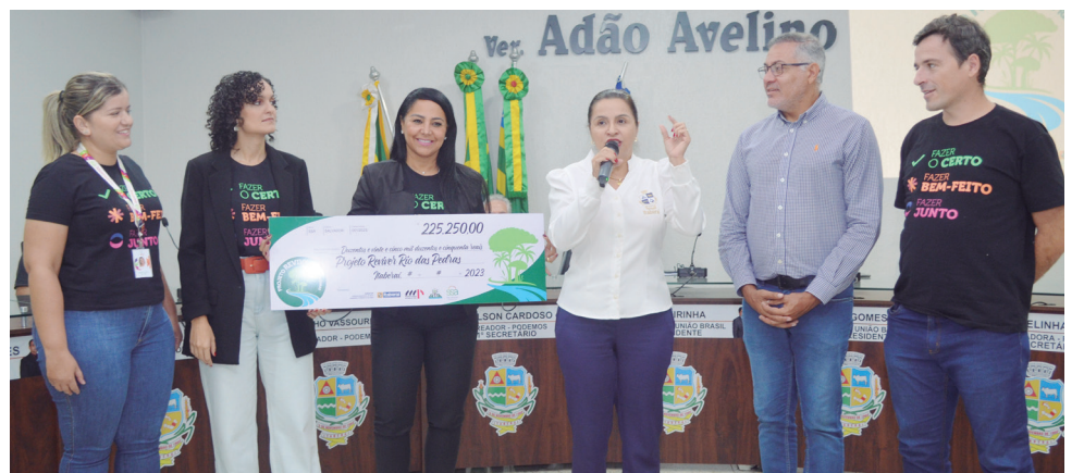
Projeto de preservação do Rio das Pedras tem apoio da São Salvador Alimentos

Em comemoração ao Dia Mundial da Água, a Prefeitura de Itaberaí lançou o "Projeto Rio das Pedras - Conhecer, Recuperar e Preservar", desen-