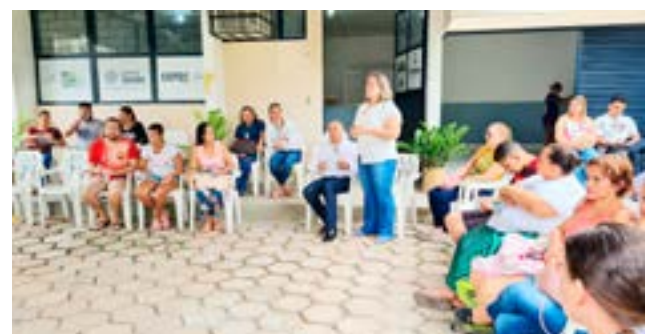
Encontro com empreendedores faz parte da estratégia para transformar o Município de Goiás em importante pólo da confecção do Estado de Goiás