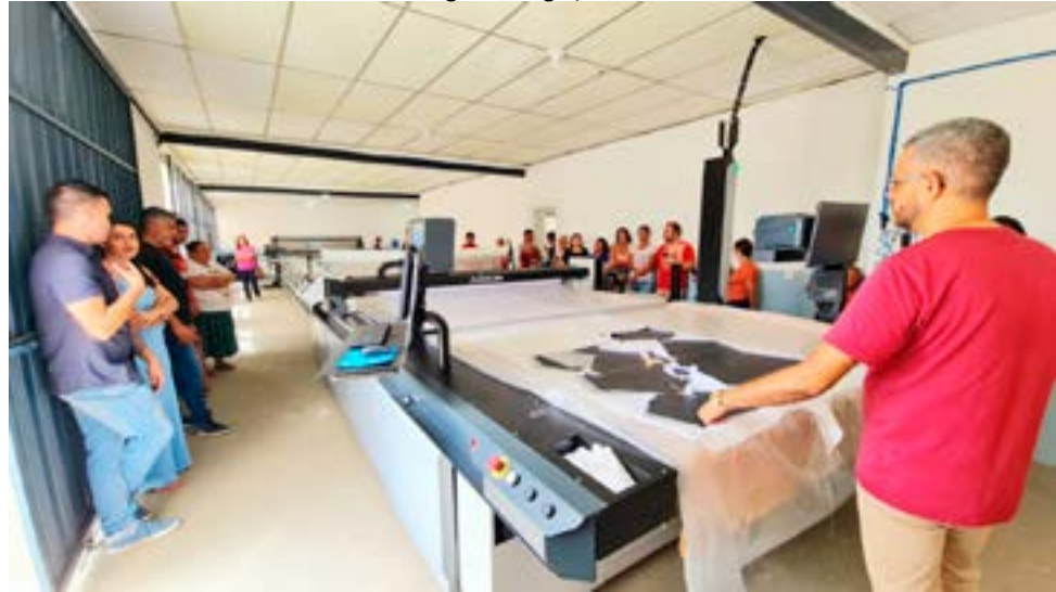
Empreendedores acompanham apresentação da Audaces, uma das mais eficientes do mundo

Foi realizado no dia 26 de janeiro o encontro sobre o Projeto Alinhavar, no Arranjo Produtivo Local (APL) da Moda, no setor Aeroporto, ao lado do CRAS (antiga OEC). A pauta central foi a transformação da Cidade de Goiás em um pólo de confecção, fomentando a economia local, gerando mais empregos e renda no setor de corte e costura. No