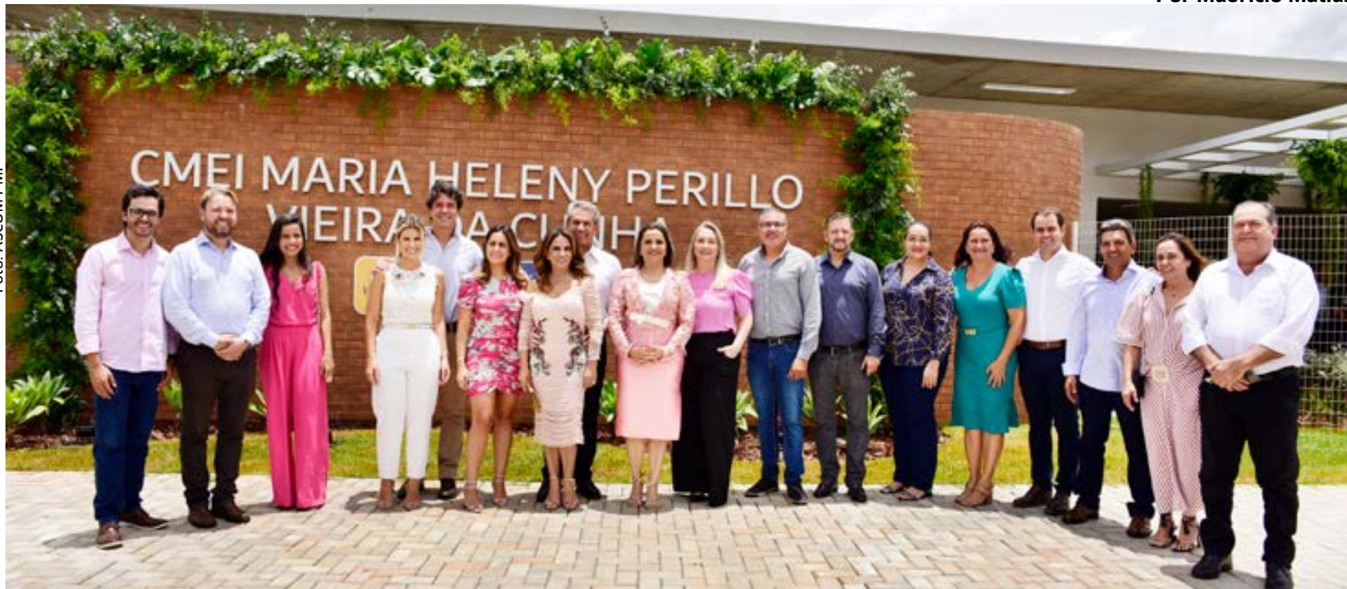
Instalado no Setor Itavilly, CMEI foi construído com recursos próprios do município no valor de R$ 3,9 milhões