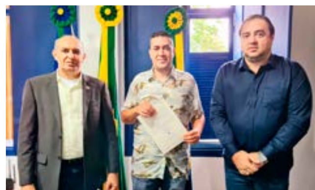
No total foram 291 pessoas convocadas, entre aprovadas e classificadas em reserva técnica para todas as vagas disponíveis