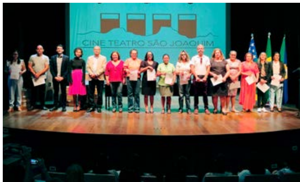
Novos diretores da rede municipal de ensino de Goiás foram empossados