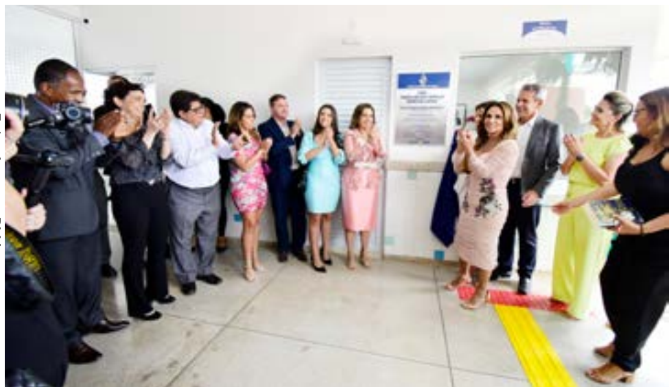
Inauguração contou com autoridades e familiares da homenageada

A Prefeitura de Itaberaí, através da Secretaria Municipal de Educação, inaugurou na terça-feira (24), o Centro Municipal de Educação Infantil (CMEI) localizado no Setor Itavilly, que atenderá 300 crianças com idade de 8 me-