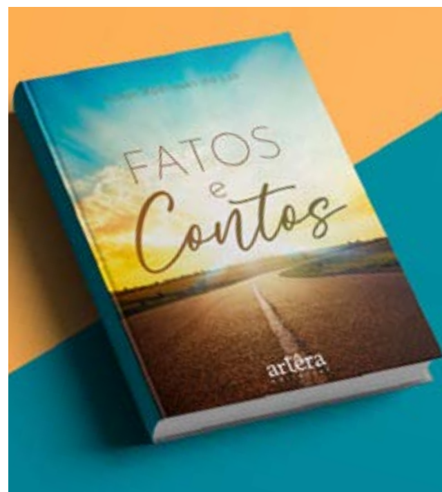
A obra será lançada em breve em Itaberaí

As pessoas interessadas em adquirir podem acessar o SITE da Editora: www.editoraappis.com.br inserindo o código FATOS20 no campo “vale desconto”.