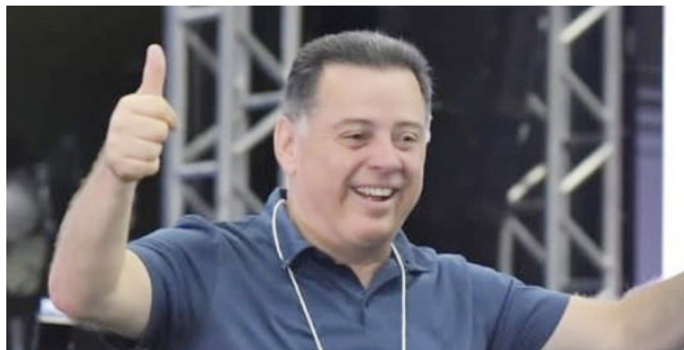
Anúncio final de qual cargo vai concorrer só deverá ser feito na convenção estadual do PSDB

realizadas até agora e tenho apoio de muitas lideranças, coisa que não tive na eleição passada e essas lideranças estão vindo por causa do apoio do governador Marconi Perillo. Ele tem serviço prestado em todo o estado”, disse ele.