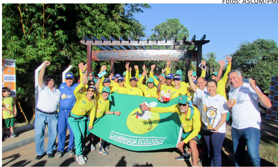
Ciclistas na Ponte Velha, um dos cartões postais de Itaberaí

A prefeita acompanhou os atletas até o almoço na famosa e aconchegante casa da Dona