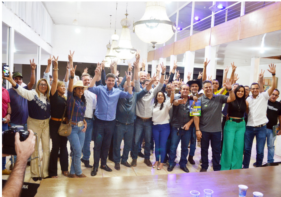
Ao lado do ex-senador Wilder de Moraes, Major Vitor Hugo participa de encontro regional do PL em Itaberaí