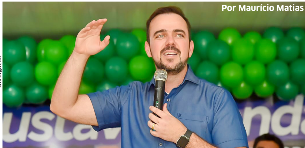
Gustavo Mendanha durante discurso em Itaberaí

O pré-candidato ao Governo de Goiás, Gustavo Mendanha (Patriota), esteve em Itaberaí, no dia 08 de julho, para ampliar o diálogo com instituições de classe, religiosas e