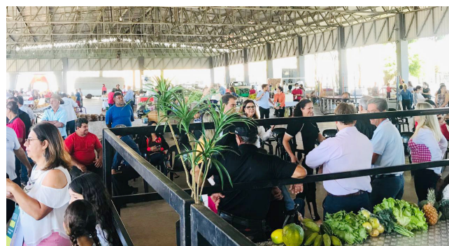
Evento foi realizado no Espaço Municipal de Eventos