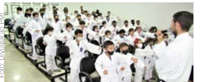
Evento de entrega dos quimonos em Itaberaí