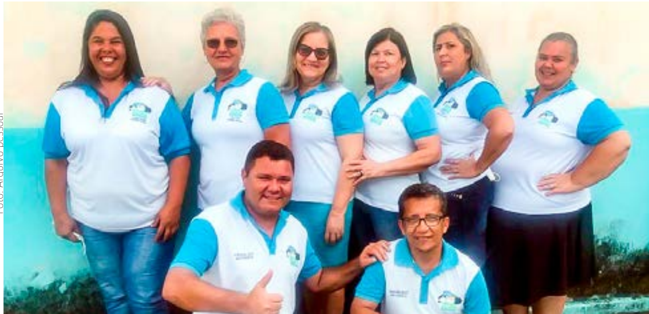
Equipe do Conselho Tutelar de Itaberaí