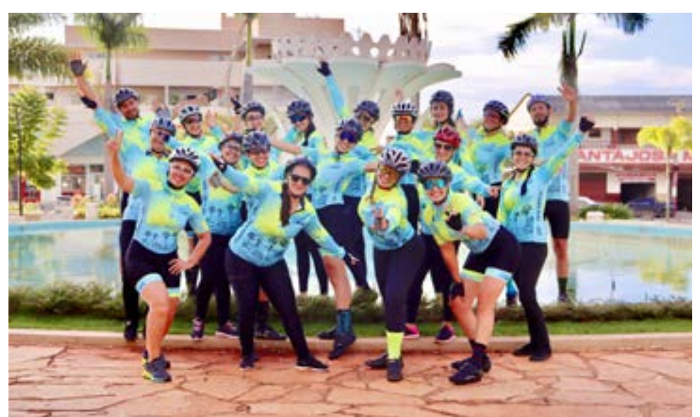
Registro da equipe "Vou de Bike" feito na Praça Balduino Silva Caldas, centro de Itaberaí

E outro ponto importante a ser levado em consideração é que para qualquer prática esportiva o uso de roupas específicas para garantir o conforto, a segurança e tornar esses momentos especiais com a galera, cheio de alegria, criatividade e para garantir boas risadas. Ah... não podem faltar os "cliques" memoráveis como esse feito pelo grupo Vou de Bike, de Itaberaí, que incentiva o bem-estar e está de braços abertos para te receber.