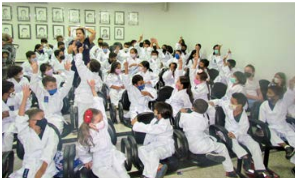
Oitenta quimonos foram entregues para alunos do projeto Construindo campeões, em Itaberaí

“O esporte une pessoas e agrega valores. E este projeto de karatê, assim como a escolinha de futebol