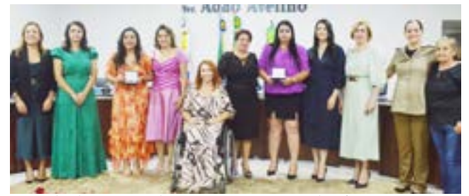
Parte das homenageadas pousaram para foto histórica