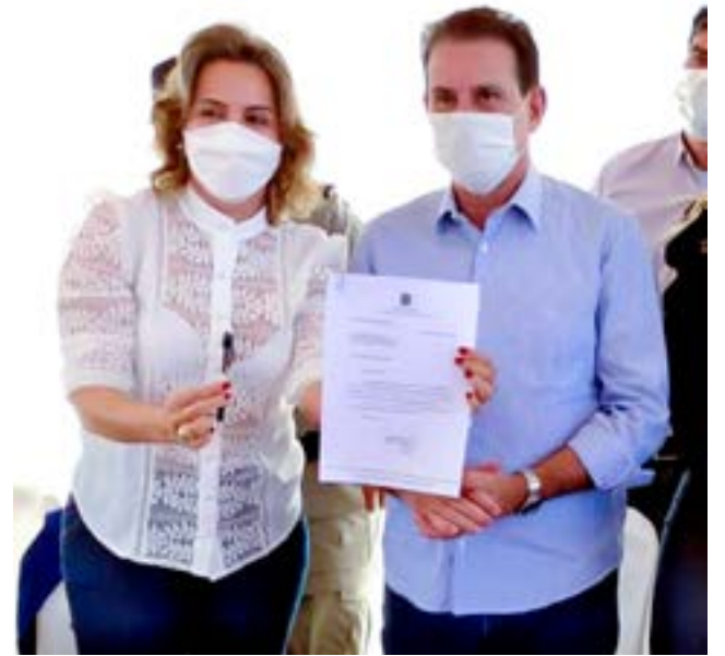
Investimento de R$ 5 milhões foi anunciado pela prefeita Rita de Cássia e pelo senador Vanderlan Cardoso

O senador Vanderlan Cardoso firmou compromisso de R$ 2,5 milhões para pavimentação asfáltica no Alto da Boa Vista. Outros R$ 2,5 milhões serão investidos pela Prefeitura Municipal de Itaberaí para completar o asfalto naquele setor. O anúncio foi feito pelo senador e pela prefeita Rita de Cássia no setor Alto da Boa Vista.