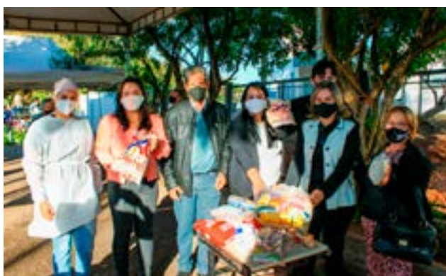
Vacinação solidária arrecada alimentos

A Prefeitura Municipal de Itaberaí através da Secretaria de Saúde promove a campanha "Vacinação Solidária", que consiste em arrecadação de alimentos a serem distribuídos à população em vulnerabilidade