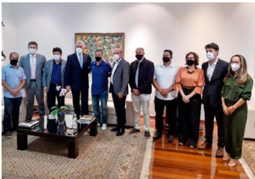
Governador Caiado diz que Caminho de Cora Coralina terá projeção mundial

Itaberaí irá receber a instalação de um ponto de apoio aos turistas, no Povoado de São Benedito, cuja obra tem previsão de terminar até dezembro deste ano. Com isso, a Prefeitura e o governo de Goiás trazem mais um benefício para a nossa cidade.