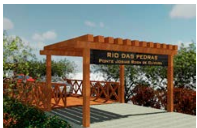
Projeto de reforma da ponte Josias Rosa de Oliveira

A ponte velha situada sobre o Rio das Pedras estará interdita por um período aproximado de 30 (trinta) dias a partir do dia 19/07/2021 para ser refeita. A necessidade de reforma deu-se pela periculosidade que a ponte apresentava aos pedestres e carros que trafegam por esse caminho. Toda sua estrutura será reforma-