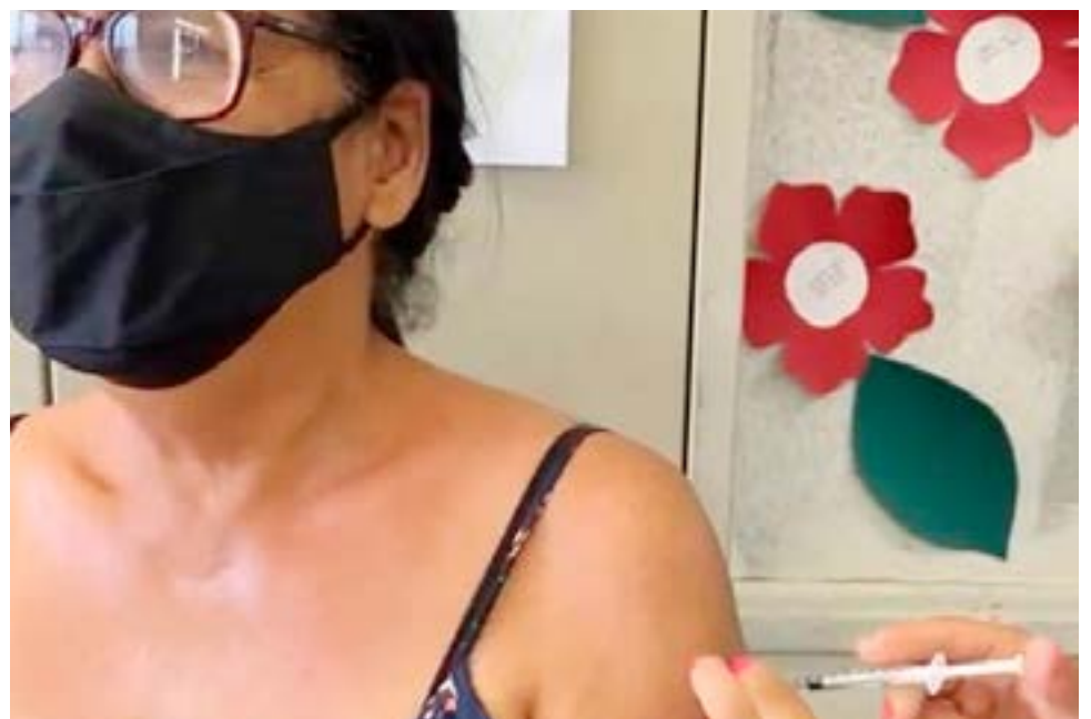
A Prefeitura Municipal de Itaberaí através da Secretaria da Saúde cumprindo o Plano Nacional de Imunização, cuidando da saúde e bem estar de seus cidadãos

A atual gestão municipal tem por princípio inabalável a preservação da vida dos Itaberinos, desde então não mediu esforços na garantia dos direitos da população, adequado controle e usabilidade de medicamentos, insumos e oxigênio.