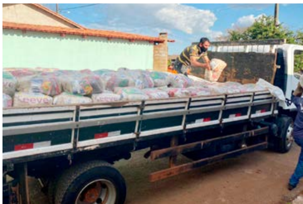
Prefeitura de Itaberaí através da Secretaria de Assistência Social, distribui cestas básicas para complementação alimentar das famílias em situação de vulnerabilidade