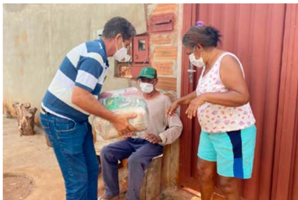
Família recebe cesta básica fornecida pelo Município