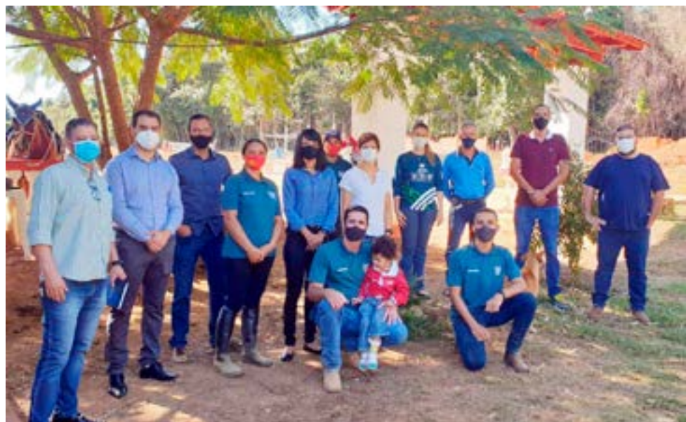
Grupo de trabalho que compôs a visita ao Centro de Equoterapia Curralinho

O Centro de Equoterapia Curralinho (CEC) recebeu a visita de parceiros que representam o alicerce para o funcionamento desta entidade.