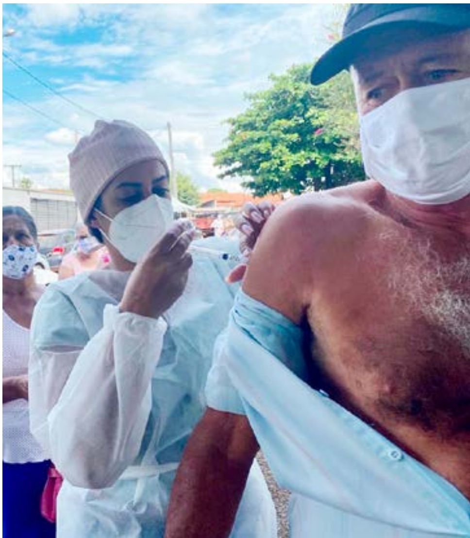
A Prefeitura Municipal de Itaberaí através da Secretaria da Saúde cumprindo o Plano Nacional de Imunização, cuidando da saúde e bem estar de seus cidadãos

A vacinação é uma medida adotada como prioridade em relação à saúde e ao combate a pandemia (COVID-19) no município de Itaberaí, sempre seguindo rigorosamente os critérios do Plano Nacional de Vacinação – PNI, ressaltando e demonstrando a transparência