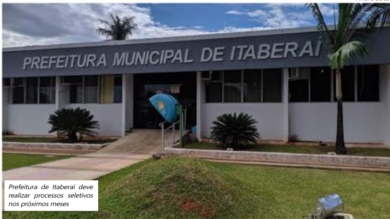
Prefeitura de Itaberaí deve realizar processos seletivos nos próximos meses

APROXIMADAMENTE 10% DA POPULAÇÃO DE ITABERAÍ