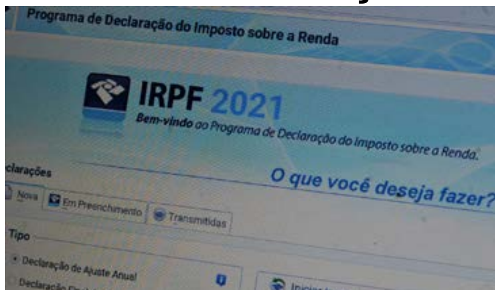
Projeto de lei foi encaminhado para apreciação no Senado

A Câmara dos Deputados aprovou a prorrogação do prazo para a entrega da declaração do Imposto de Renda de