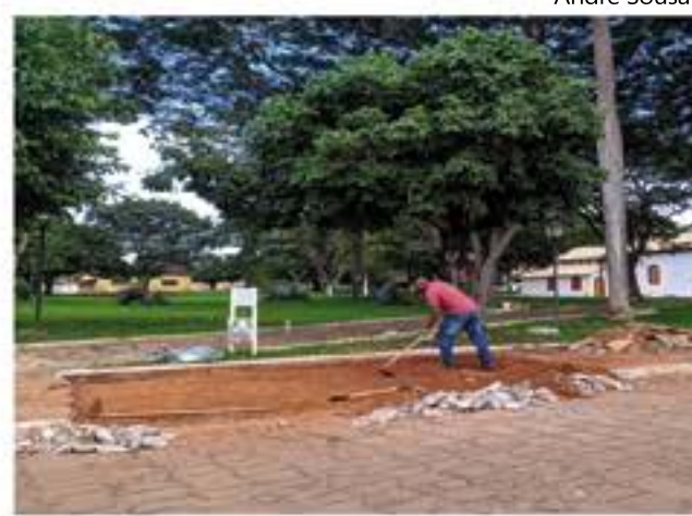
Funcionário faz troca de calçamento na Praça da Matriz

pandemia, os materiais estão mais caros no mercado e, por isso, a obra vai precisar receber um suporte financeiro para ser concluída. "Não vamos entregar a praça incompleta. A população itaberina não merece isso. Vamos concluí-la o quanto antes. O mesmo ocorre com a obra da Praça do Jardim Cabral. Conversamos com a construtora responsável, que já retomou o