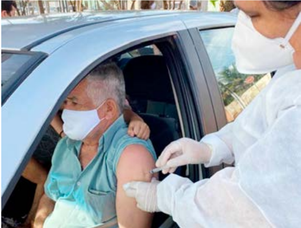
Equipe da Secretaria de Saúde durante vacinação em Itaberaí

Prefeitura de Itaberaí comemora vacinação de 10% da população em menos de três meses. Prefeita Rita de Cássia conta que município vai comprar imunizantes por meio de consórcio entre cidades e celebra a abertura de ala exclusiva para pacientes com coronavírus no hospital.