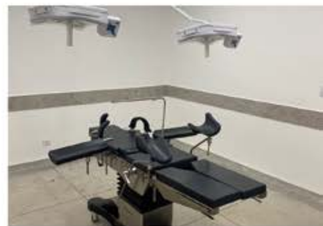
Hospital ganha centro cirúrgico e leitos exclusivos para Covid