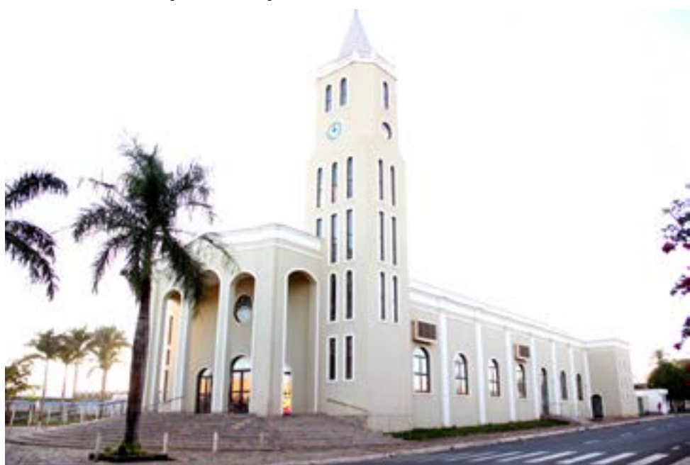
Igrejas de Itaberaí também foram afetadas por decretos do município e do estado desde o início da pandemia

Nunes Marques deu razão à Anajure. "A proibição categórica de cultos não ocorrer em estados de defesa (CF, art. 136, § 1º, I) ou estado de sítio (CF, art. 139). Como poderia ocorrer por atos administrativos locais?", indagou o ministro. "Reconhe-