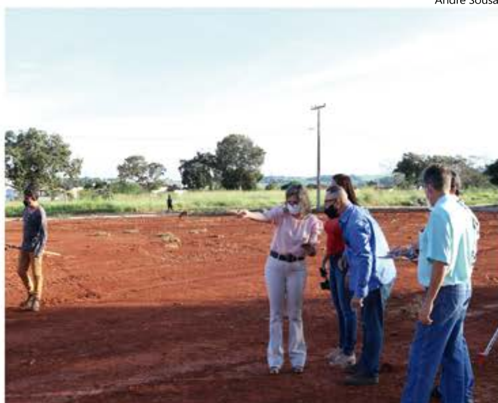
Prefeita fiscaliza obra do novo Centro Municipal de Educação Infantil no Residencial Itavilly

A creche está localizada na Avenida Eixo Norte Sul, num terreno de 2.462,64 m 2 . O prédio vai contar com 6 salas, sendo 3 para berçário e 3 para maternal, além de banheiros, sala multiuso, recepção salas de administração, além de espaços livres com jardim para brincadeiras. A planta tem a configuração em U, terá um bloco destinado para as salas, outro para o setor pedagógico-cozinha e serviços.