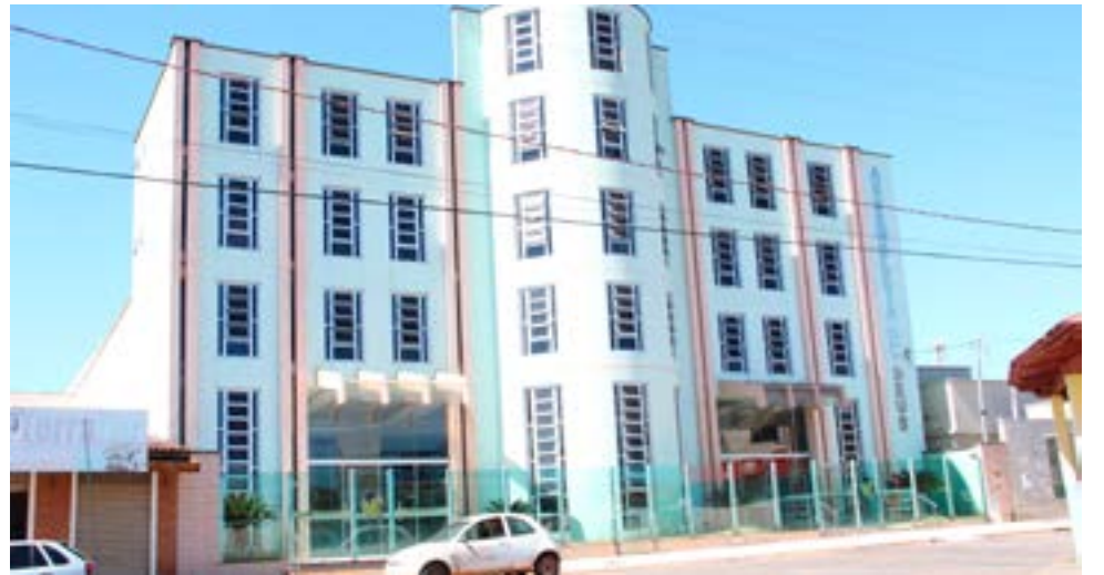
Igrejas podem funcionar com capacidade reduzida

O entendimento é do ministro do Supremo Tribunal Federal (STF) Nunes Marques, que ordenou que os estados, o Distrito Federal e os municípios permitam a realização de celebrações religiosas presenciais, ainda que com, no máximo, 25% da capacidade. A porcentagem foi inspirada em julgamento de caso similar pela Suprema Corte dos Estados Unidos. O ministro atendeu a um pedido de liminar feito pela Associação Nacional de Juristas Evangélicos (Anajure). Para a entidade, o direito fundamental à liberdade religiosa estava sendo violado por diversos decretos estaduais e municipais que proibiram os cultos de forma genérica. Página 6