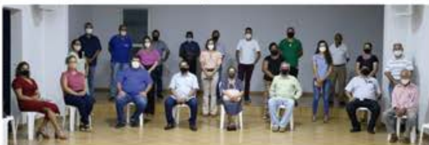
Reunião com diversas entidades para darmos início a um projeto social: AMFEPARK, Câmara Vereadores, Centro Espírita (Aprendiz de Jesus-Vicente de Paula), Igreja Ass. de Deus Campinas, Igreja Ass. de Deus Itaberá, Igreja Ass. Ministério Fama, Igreja Ass. Deus Vila Nova, Igreja Católica, Igreja Deus é amor, Igreja Fonte da Vida, Igreja Hebrôm, Igreja IBN Batista - Sementes do Reino, Igreja, Igreja Presbiteriana, Igreja Videira, Maçonaria (Grande Oriente e Vitória Razão) e Sindicato Trabalhadores.

Em meio à pior onda da Covid-19, com muitos itaberinos em situação de vulnerabilidade, a Prefeitura de Itaberá passou a distribuir cesta básica, máscara facial e álcool em gel através da Secretaria de Assistência Social, em parceria com empresários do município.