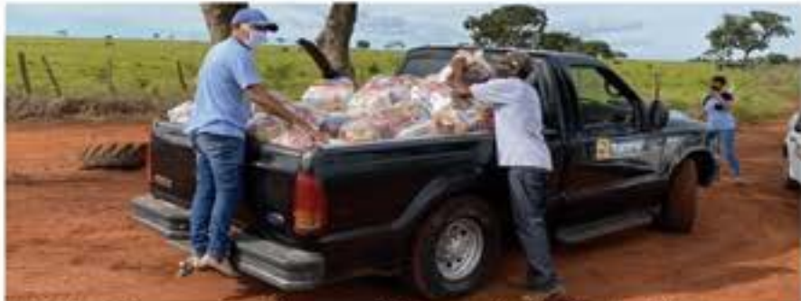
Mais de 600 cestas de alimentos já foram distribuídas famílias carentes