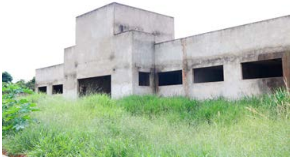
UBS's Itavilly, obra paralisada, mas com gestão da nova 'prefeita para não perder os recursos

As Unidades Básicas de Saúde (UBS's) dos bairros Itavilly e Jardim Esmeralda requerem atenção especial. "Desde 2013 os recursos vêm sendo repassados pelo Gover-