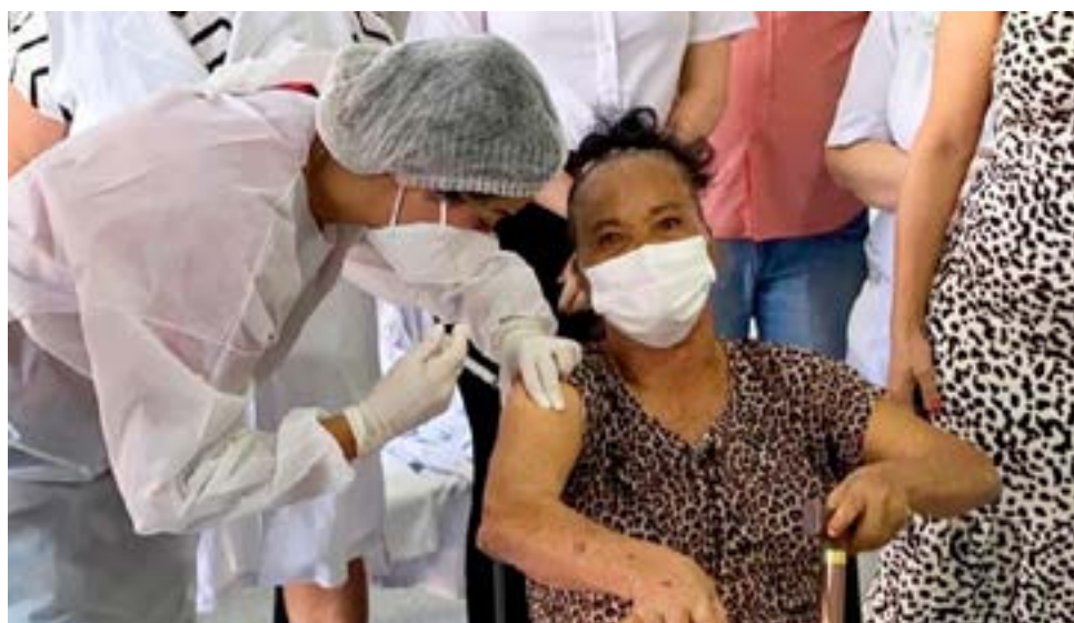
Itaberaí vacinou cerca de mil pessoas com primeira dose contra a Covid-19, entre elas trabalhadores da saúde e idosos

Deixar de usar máscara de proteção em ambiente coletivo gera punição de multa de R$ 550. A participação em eventos que gerem aglomeração será punida com multa de R$ 550. Já a realização de eventos que gera aglomeração de pessoas será punida com multa de R$ 5 mil reais para organizador, mesmo valor para o dono do espa-