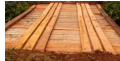
São Domingos - Região Soledade - Depois