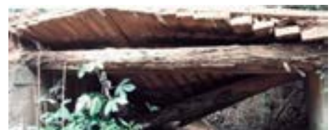
Rio das Pedras - Região Barreiro Mato Dentro parceria com SSA - Antes