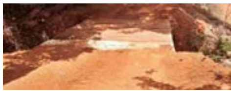
Rio das Pedras - Região Barreiro Mato Dentro parceria com SSA - Depois