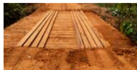
Ponte de ligação Gongomé/Retiro 2 - Depois