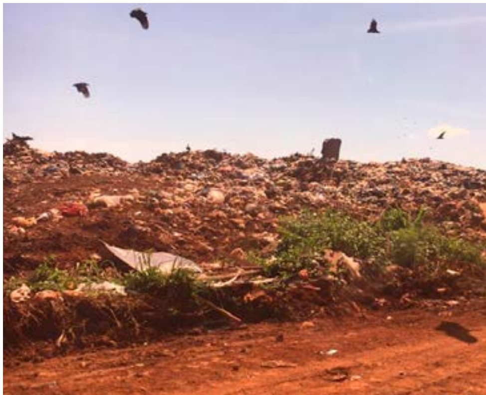
Representantes do estado e do município discutem solução para o lixão a céu aberto

"Para onde olhamos os problemas brotam. O aterro sanitário está lá com seus 20 metros de altura e sem o cuidado que deveria ter recebido. Literalmente empurraram o lixo para debaixo do tapete, ou para cima, como queiram. Com isso, estão retidos R$ 2 milhões de recursos do nosso município para o aterro".