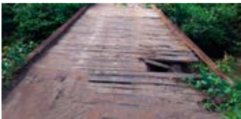
São Domingos - Região Soledade - Antes