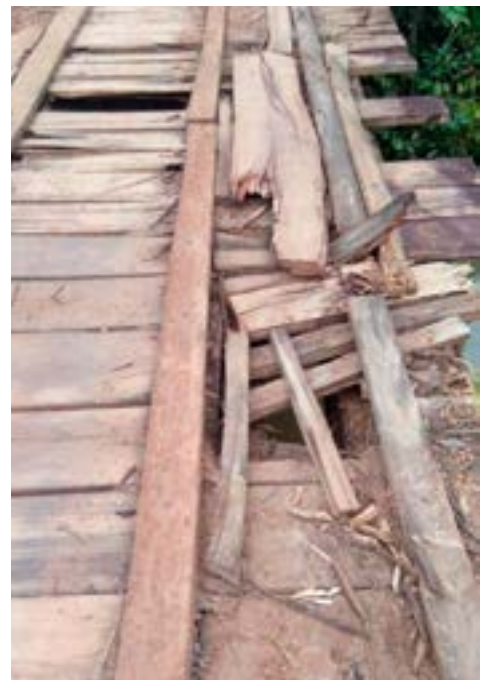
Ponte de ligação Gongomé/Retiro Antes