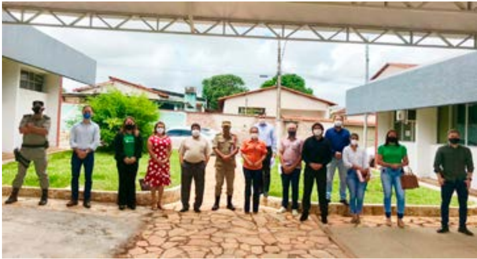
Membros do Comitê de Enfrentamento à Covid-19 - COITA