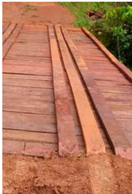
Ponte de ligação Gongomé/Retiro Depois