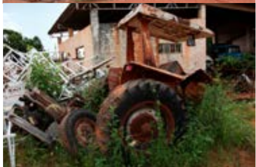
Garagem municipal: um pouco do que foi herdado da administração anterior