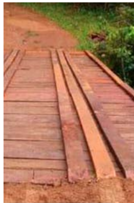
Ponte Fazenda Santa Rita, Córrego Laranjal, depois da reforma