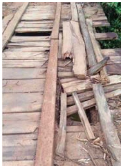
Ponte Fazenda Santa Rita, Córrego Laranjal, antes da reforma

novos desafios todos os dias. "Assim, vamos caminhando junto com o povo de nossa cidade, tendo a certeza de dias melhores. Nestes poucos dias de administração já avançamos. Revisamos contratos, notificamos constru-