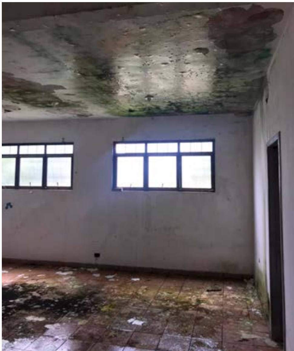
Prédio da antiga UEG, no Jardim Cabral

"A cidade sempre foi o elo mais próximo entre uma administração e seu povo. Ela 'fala muito' de como é o seu prefeito. Quando assumimos encontramos uma cidade abandonada, com mato alto nas ruas, lixo por toda parte, luminárias queimadas que causava um