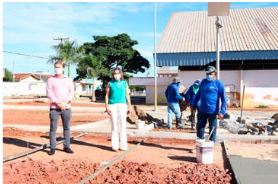
Após um diálogo aberto com a construtora responsável pela reforma da praça do Jardim Cabral I, já foi retomada as obras.