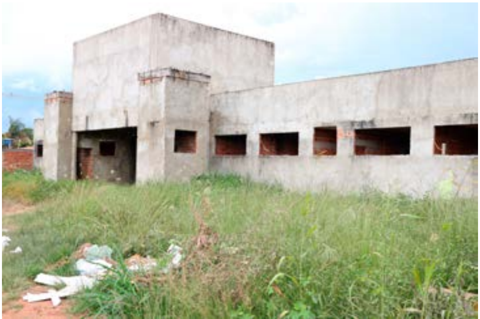
UBS Jardim Esmeralda, obra paralisada. Gestão feita pela atual administração para não perder os recursos

são e outras situações ocorridas. Além disso, o município corre o risco de devolver os valores repassados pelo Governo Federal. O município havia recebido 80% do valor estimado,