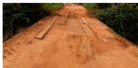
Ponte de ligação Gongomé/Retiro 2 - Antes