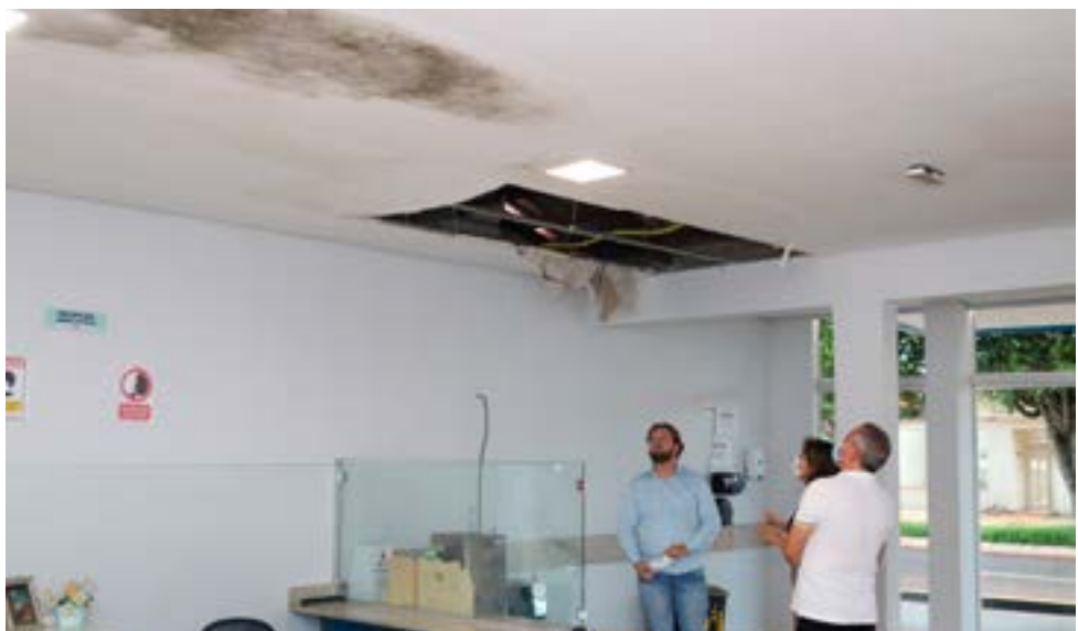
Reparos no prédio do Hospital Municipal em análise pelos representantes da prefeitura

O Hospital Municipal exigiu ação rápida e disposição da atual gestão para retomar os diversos contratos que estavam paralisados. Esta obra até hoje se arrasta. "No hospital está clara a falta de cuidado com o dinheiro público e a má administração da gestão