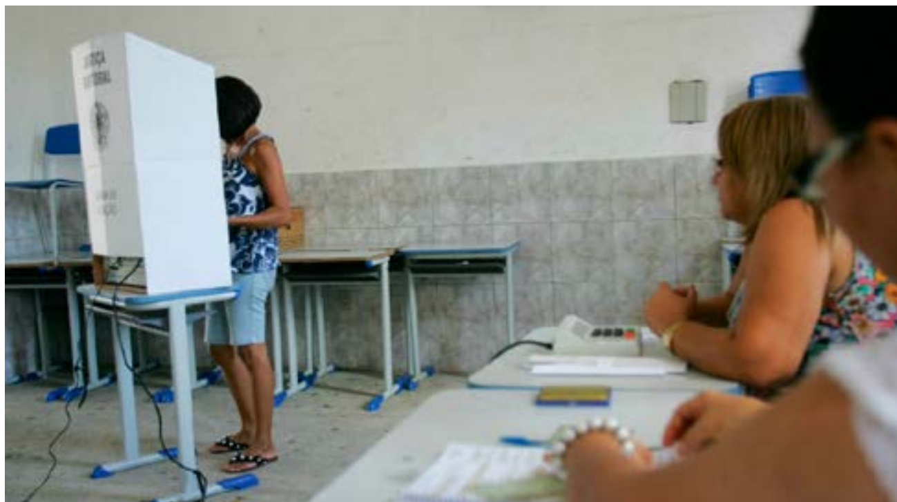
Eleições 2020 tem características diferentes por causa da pandemia, mas eleitores prometem votar

Dados divulgados na semana passada pelo Tribunal Superior Eleitoral (TSE) mostram que o Brasil contava com 147.918.483 eleitores aptos a votar nas Eleições 2020.