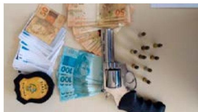
Ocorrências por crimes eleitorais dominaram as ações da PM no domingo

Ao todo, a Polícia Militar de Goiás empregou 7,9 mil profissionais, que reforçaram a segurança nos municípios goianos durante o primeiro turno das eleições municipais. Uma das novidades neste ano foi a parceria com a Justiça Eleitoral, que proporcionou à PM o monitoramento dos locais de votação por meio de drones. Para garantir a ordem durante o pleito, a Polícia Civil também realizou plantão em todas as delegacias no Estado.