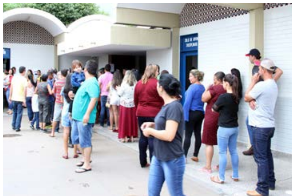
Medidas do TSE visam evitar fila como esta registrada nas eleições de 2018 no Colégio Militar Maria Heleny Perillo

As eleições deste ano para a escolha de prefeitos e vereadores terão várias mudanças em relação aos pleitos anteriores. Há mudanças no sistema de candidaturas para vereadores e novas ações da Justiça Eleitoral para evitar proliferação de fake news (notícias falsas). A pandemia do coronavírus também impôs uma série de ações, em especial, a mudança do calendário eleitoral.