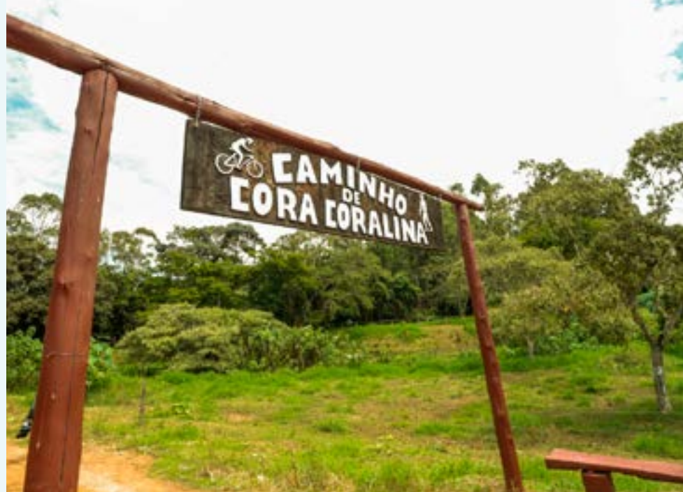
Trilha tem 300 quilômetros, cruza cinco cidades históricas e outros três municípios