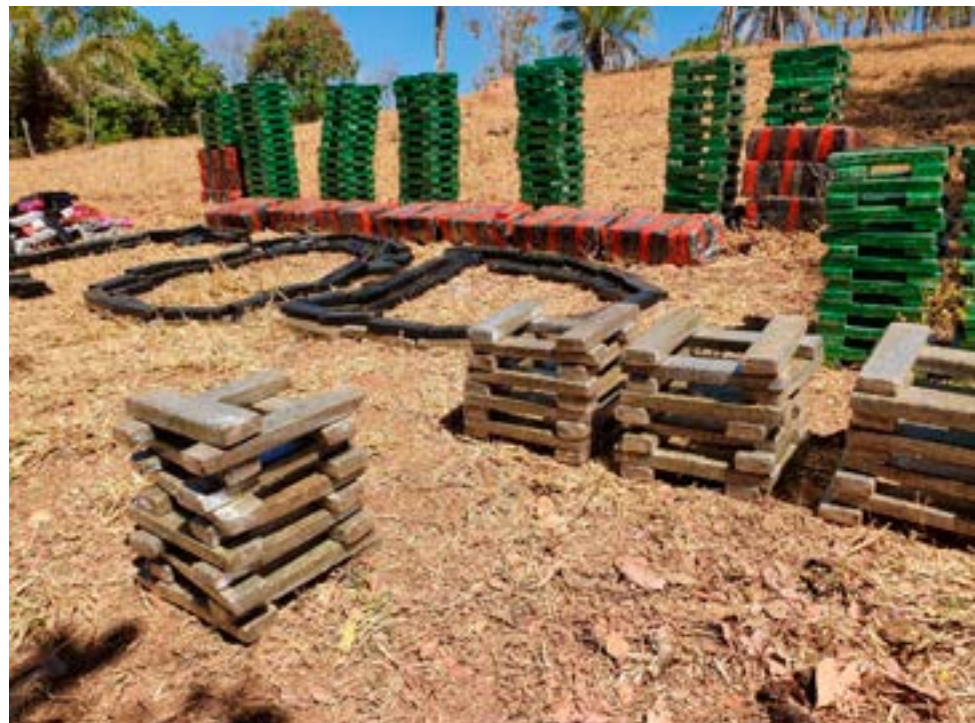
Grande apreensões de drogas marcaram a semana de atuação da Polícia Militar

Em poucas horas foram apreendidas 1,6 tonelada de entorpecentes