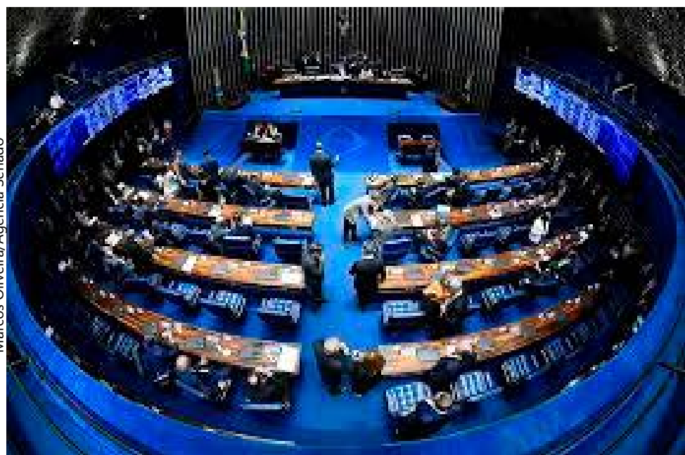
Matéria segue para sanção presidencial

O Senado aprovou na quarta-feira (9/9) um projeto de lei (PL) que cria um Cadastro Nacional de Pessoas Condenadas por Crime de Estupro. Esse cadastro sairá de uma cooperação entre União, estados e municípios. A formatação dessa cooperação dirá a forma de atualização e formatação das informações. Os recursos para o desenvolvimento e a manutenção do cadastro virão do Fundo Nacional de Segurança Pública (FNSP). A matéria segue para sanção presidencial.