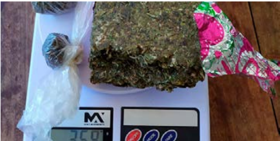
Droga apreendida pela Polícia Militar em Itaberaí