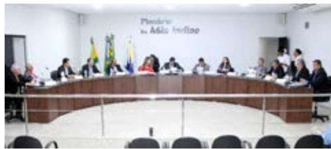
Câmara Municipal de Itaberai é formada por 13 vereadores

Nas eleições majoritárias (para prefeito, governador, senador e presidente) considera-se o voto em cada candidato, e o