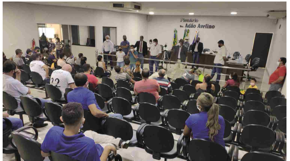
Na Câmara Municipal vereadores e comerciantes defendem flexibilização de setores representados

de acordo com regras específicas. A decisão em definitivo era aguardada para a última quarta-feira (13), data em que o comitê instituído para deliberar sobre medidas restritivas durante a quarentena teria uma nova reunião. "Entendo como justa a flexibilização para que os comerciantes voltem a trabalhar. São dezenas de famílias que dependem dessas atividades para manterem seus empregos. Claro que tudo deve ocorrer dentro das nor-