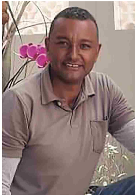
Fernandinho Paisagista 26/05