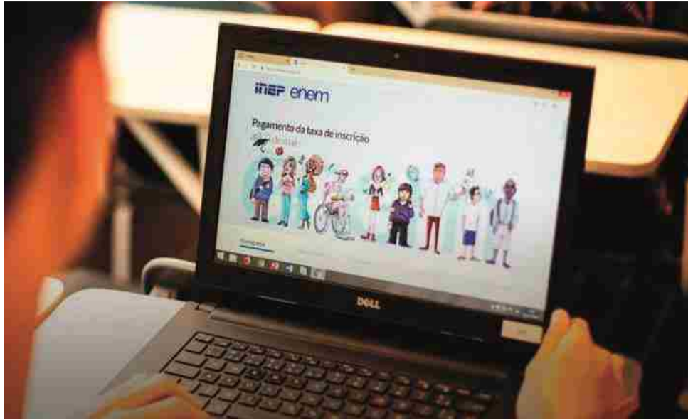
Participante pode optar entre exame impresso ou digital

As inscrições para o Exame Nacional do Ensino Médio (Enem) 2020 começaram na segunda-feira (11) e vão até o dia 22 de maio. Elas poderão ser feitas por meio da página do Enem na internet.