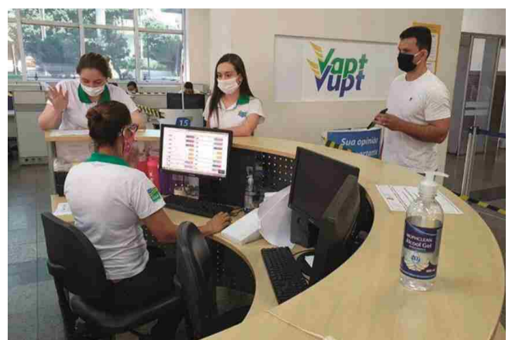
Atendimento ao GoiásFomento pode ser acessado nas unidades do Vapt Vupt

Em abril último, a GoiásFomento firmou convênio com o Sebrae Goiás, para operar o Fundo de Aval para Micro e Pequenas Empresas (Fampe) para realizar até R$ 36 milhões em operações de crédito. Outra medida anun-