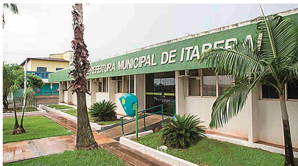
Fachada da Prefeitura de Itaberaí

da meta estabelecida pela Lei de Responsabilidade Fiscal (LRF). Excluídos os gastos com credenciamento de pessoal da saúde, a Prefeitura de Itaberaí efetivou despesa de R$ 53,3 milhões, correspondente a 53,87% da receita corrente líquida. "As prefeituras podem gastar até 54% da receita líquida com folha de pagamento. Tanto em 2019 quanto em 2020 ficamos dentro da meta e todas as prestações de contas ao TCM foram feitas dentro do prazo, assegurando o cumprimento das obrigações constitucionais e deixando o Município de Itaberaí com boa saúde financeira. Mesmo diante da crise que estamos passando, esperamos concluir nosso mandato com todas as contas aprovadas e pronta para a próxi-