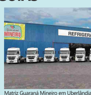
Matriz Guaraná Mineiro em Uberlândia

A empresa Guaraná Mineiro vai investir R$ 100 milhões para implantar sua fábrica em Aparecida de Goiânia. Outros investimentos já estão programados pela empresa no Estado de Goiás. Página 5.