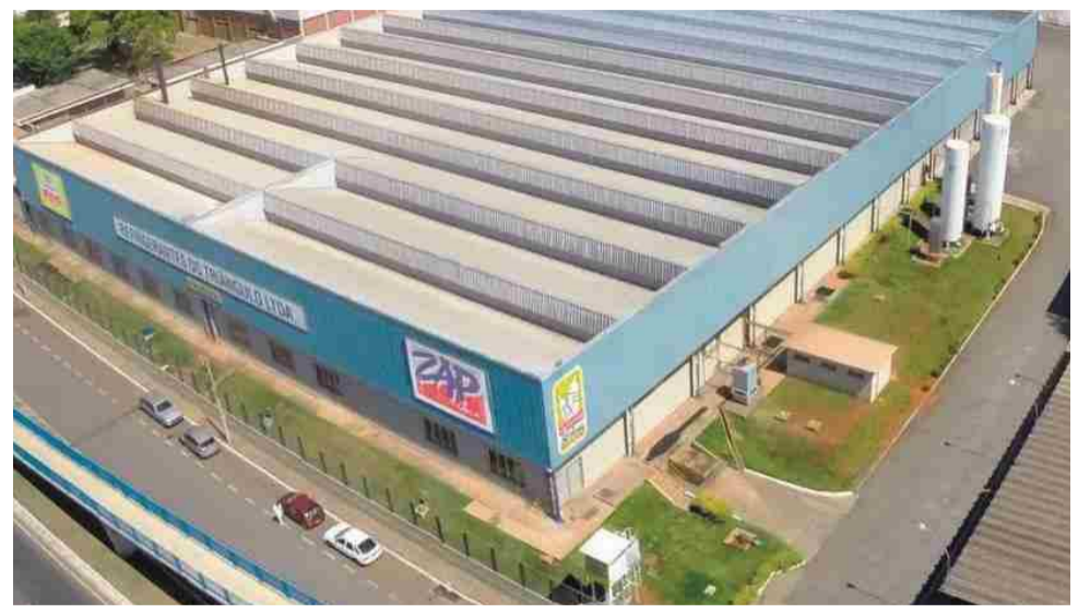
Fábrica do Guarani Mineiro em Uberlândia, no Triângulo Mineiro

"Saímos muito animados da reunião de hoje e confiantes para instalar a fábrica logo em breve. Temos um planejamento e apenas nesta primeira etapa serão investidos um pouco mais de R$ 100 milhões. Mas novos investimentos já estão