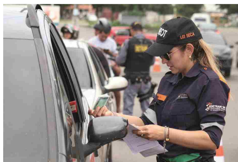
Medida vale para condutores com CNH vencidas a partir de 19 de março deste ano

No âmbito da fiscalização, ficam interrompidos, por tempo indeterminado, os prazos para que o condutor possa dirigir com Carteira Nacional de Habilitação (CNH) vencida desde 19 de fevereiro. A interrupção vale também para a Permissão de Dirigir (PPD), para expedição de Certificado de Registro de Veículo (CRV) em caso de transfe-