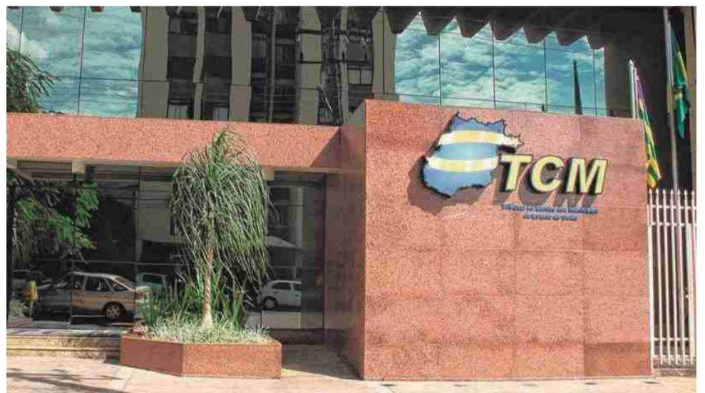
Sede do Tribunal de Contas dos Municípios, em Goiânia

de seus orçamentos. A prefeitura investiu 23,99%. As despesas com pessoal somaram 57,52% da receita corrente líquida, incluindo os repasses para a Câmara Municipal. O limite estabelecido pela Lei de Responsabilidade Fiscal é de 60% da receita corrente líquida. Confira os detalhes na página 3.