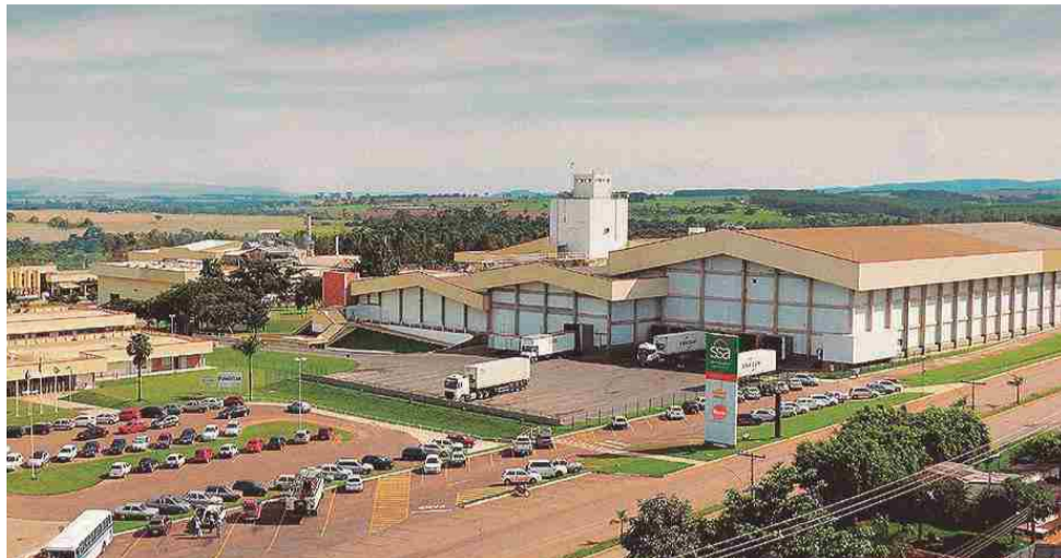
Unidade da São Salvador Alimentos de Itaberaí foi uma das empresas visitadas pela missão chilena

A SSA é uma das empresas visitadas pela missão chilena