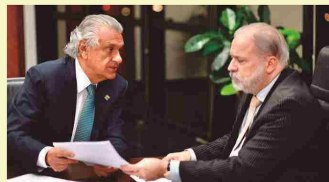
Caiado entrega alçoo ao Procurador Geral da República, Augusto Aras