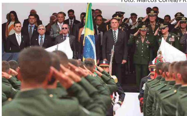
Formandos da ESA em continência ao presidente da República

publicado fotos do interior da ESA e nelas, relatado a intenção de cometer o atentado. Ele foi preso antes do