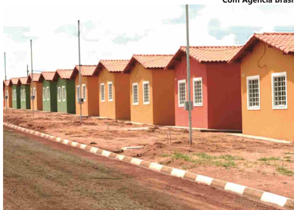
Programa passa a priorizar municípios com até 50 mil habitantes

cher dependerá dos preços correntes no mercado imobiliário no local onde o imóvel será construído. O programa trabalha com valor médio de R$ 60 mil por beneficiário, em três tipos de voucher: o de aquisição, para comprar o imóvel já pronto; o de construção, para começar a casa do zero; e o de reforma, para melhorar ou ampliar a casa já existente. A princípio, o governo pretende oferecer vouchers a famílias com renda mensal de até R$ 1,2 mil. Já as famílias com renda entre R$ 1,2 mil e R$ 5 mil mensais entrarão no programa de financiamento do programa. S e g u n d o