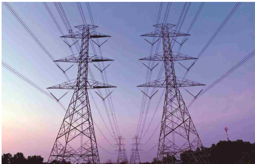
Melhorar o fornecimento de energia para áreas rurais é um desafio para a Enel Goiás

Terça-feira, 19 de novembro de 2019. Por volta de 8h15, logo após os funcionários iniciarem o atendimento no escritório da Enel em Itaberaí, um cliente chega com a câmera do celular ligada e solicita atendimento. Com educação, informa que está filmando (a ele mesmo) e solicita que a energia em sua propriedade rural seja restabelecida. A propriedade da família ficou uma semana sem energia e, depois que retornou, o fornecimento foi interrompido em menos de 24h.