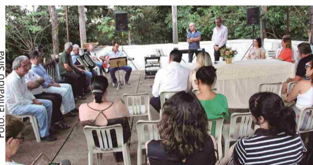
Evento marca homenagens da Aila aos 151 anos de Itaberaí

A exposição recebeu grande número de visitantes; sendo inclusive prorrogada para até 14/11/2019, em razão dos diversos agendamentos de visita. A AILA tem prestado um valioso serviço público, e é cada vez mais procurada pelas pessoas que cultuam a história e cultura de nossa cidade.