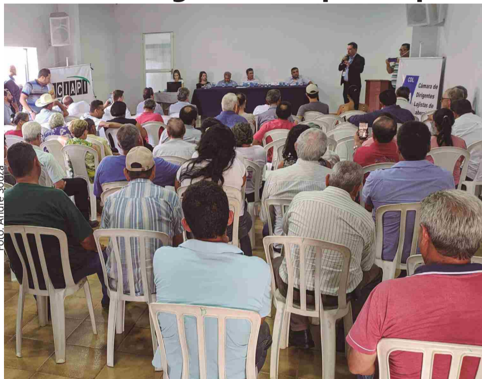
Reunidos em Itaberaí, produtores rurais e autoridades cobram soluções imediatas à Enel