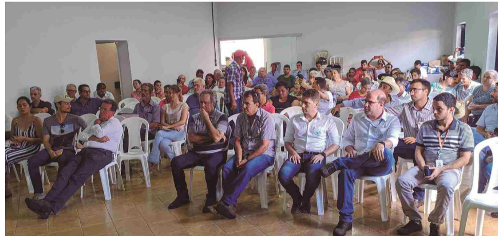
Reunião com produtores e autoridades foi realizada no auditório da Acipi-CDL