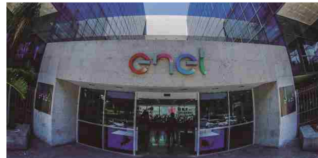
Projeto de lei apresentado na Alego põe em risco concessão da Enel