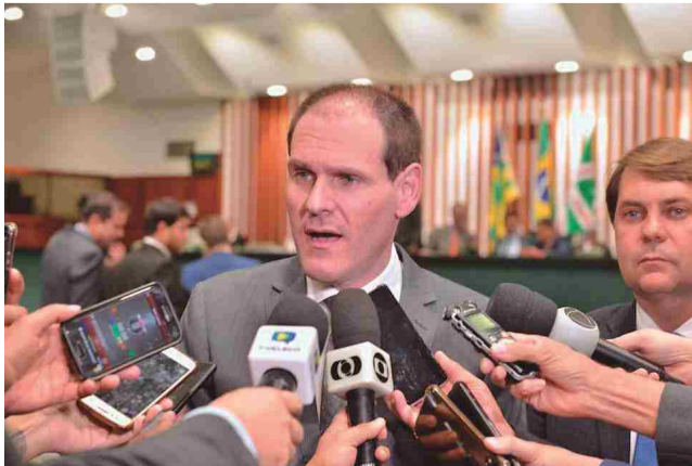
Deputado Lissauer Vieira fala sobre projeto que pode anular concessão