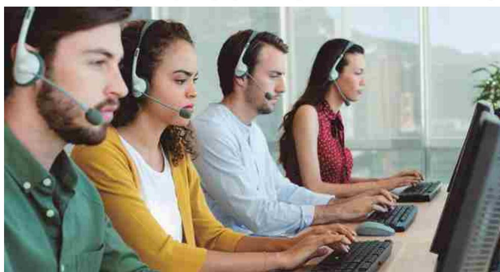
Um terço das ligações indesejadas no Brasil são realizadas para vender serviços de telecomunicações

Na prática, as empresas ficam impedidas de oferecer seus produtos e serviços utilizando o telemarketing. A Anatel determinou ainda que as áreas técnicas estudem me-