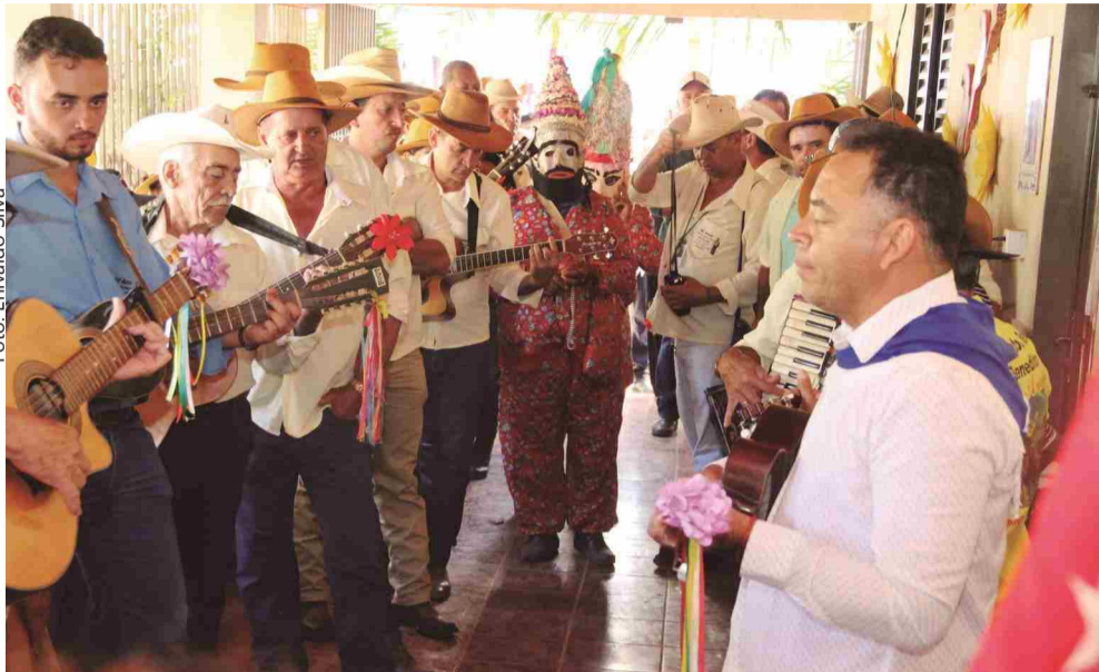
Folhões mantêm viva a tradição que arrasta multidões por onde passa

A Folia de Reis é uma manifestação cultural religiosa com forte tradição no Estado de Goiás. Especialmente na região de Itaberaí, Itaguari, Itaguari, Cidade de Goiás e cidades do entorno, ela