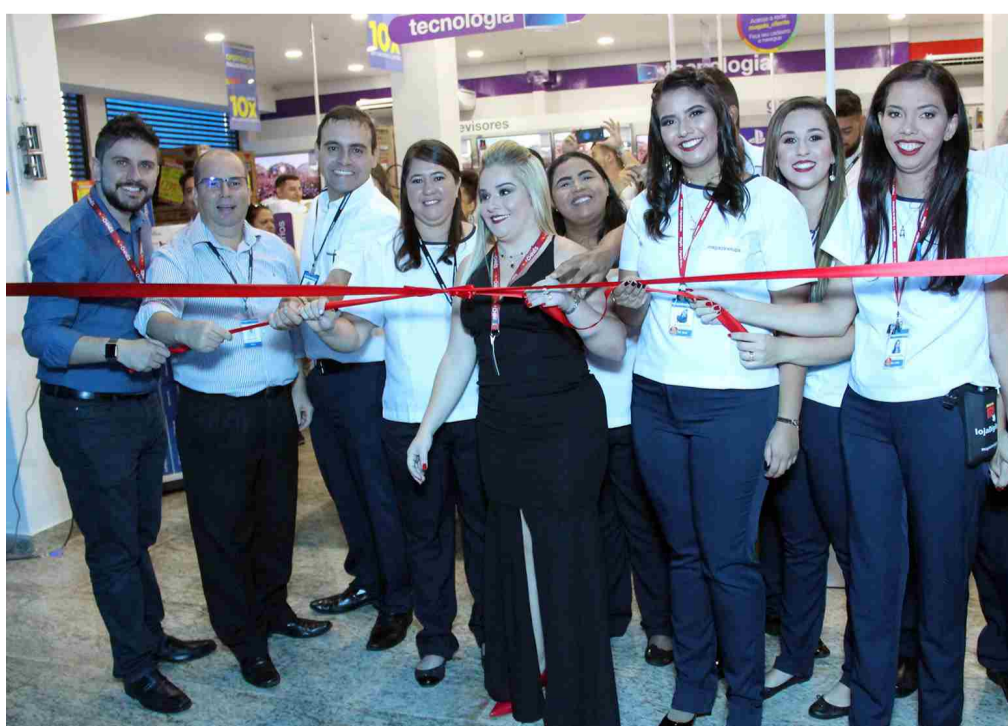
Tradicional corte da fita inaugural marcou abertura oficial da loja para atendimento a clientes

A empresa está entre as melhores para se trabalhar no Brasil e eleita a número um do varejo. Atualmente a companhia investe na integração dos canais digitais (compras online) com as lojas físicas, que além de ampliar sua presença no mercado, oferece cada vez mais serviço para o consumidor. No processo de digitalização, as lojas físicas também funcionam como centros de distribuição e são indispensáveis para a companhia.