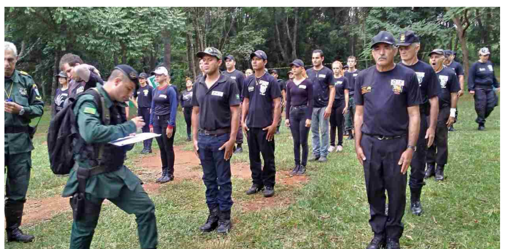
Treinamento para voluntários interessados em causa ambiental será realizado nos dias 14 e 15

ber e efetuar denúncias de crimes ambientais, desenvolve projetos de conscientização e preservação do meio ambiente.