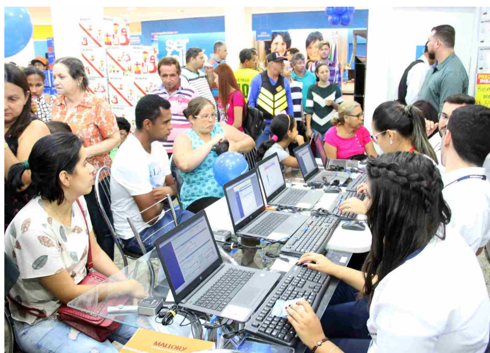
Movimento foi intenso durante todo o dia e vendas atingiram 176% da meta para a data