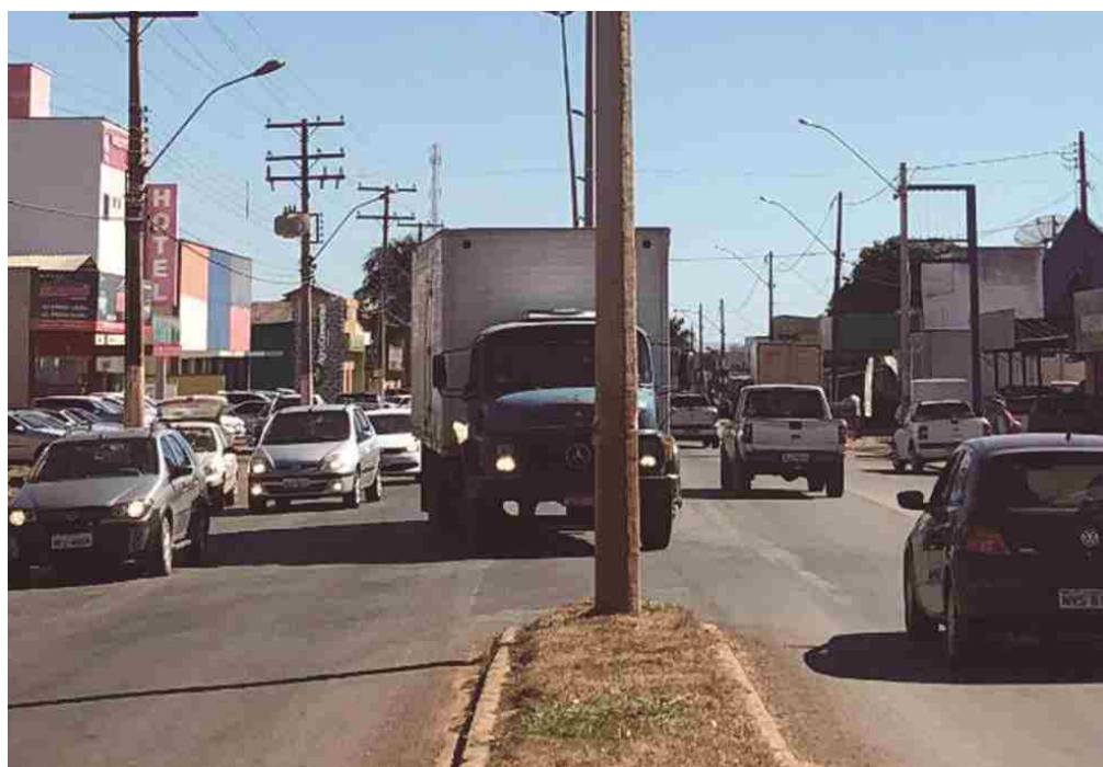
Enfrentar o trânsito pesado na Avenida Goiás é rotina diária enfrentada pelos itaberinos

Em 11 de maio de 2011, a ONU – Organização das Nações Unidas, decretou a Década de Ação para Segurança no Trânsito. Com isso, o mês de maio se tornou referência mundial para balanço das ações que o mundo inteiro realiza envolvendo a temática. O Movimento Maio Amarelo surge com a proposta de chamar a atenção da sociedade para o alto índice de mortos e feridos no trânsito em todo o mundo. A cor amarela faz referência ao sinalizador, indicando, cuidado, atenção.