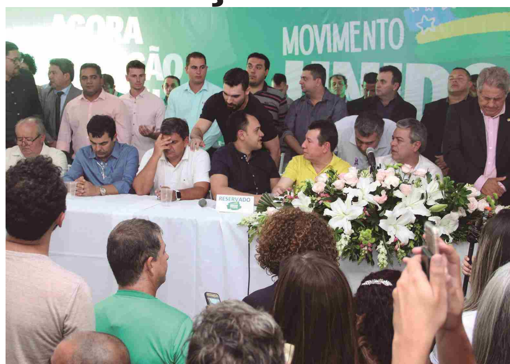
A abertura do evento ocorreu antes da chegada do governador Ronaldo Caiado que estava em outra agenda