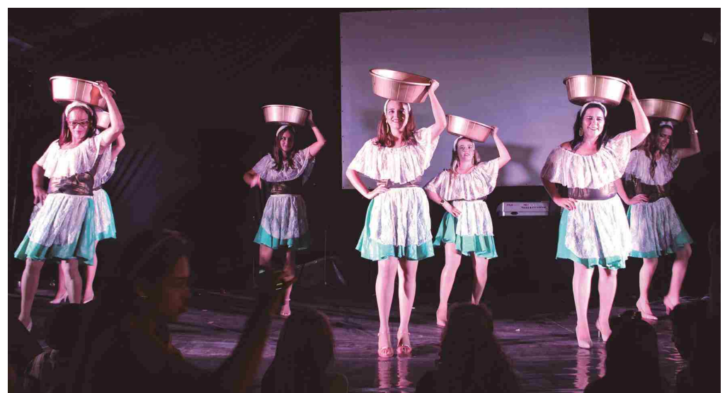
Apresentações culturais foram algumas das atrações que marcaram a 1ª edição do festival

aconteceu no dia 09 de junho uma grandiosa cavalgada com várias comitivas, seguida de almoço.