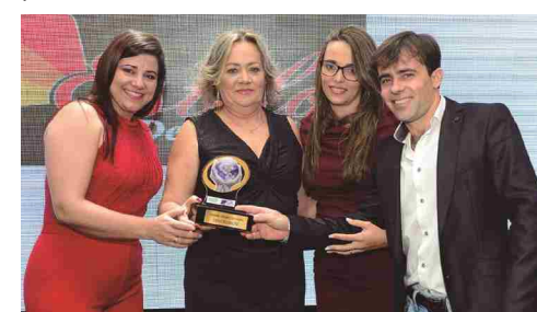
Estilo Decoração - persianas cortinas e decorações