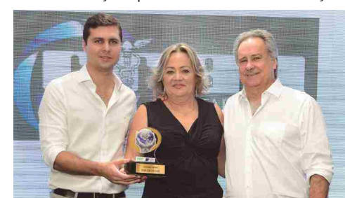
Gran Contabilidade - escritório contábil