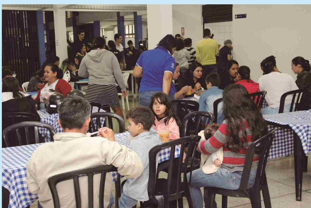
Prato social é desenvolvido por alunos da UEG, Campus Itaberaí