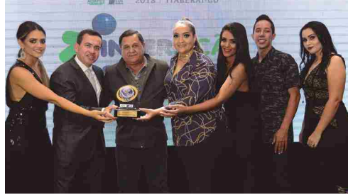
Interção Celulares e Brinquedos - papelaria