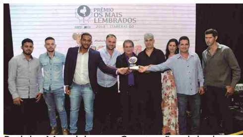
Ratinho Materiais para Construção - loja de materiais para construção