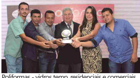
Poliformas - vidros temp. residenciais e comerciais