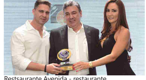
Restaurante Avenida - restaurante