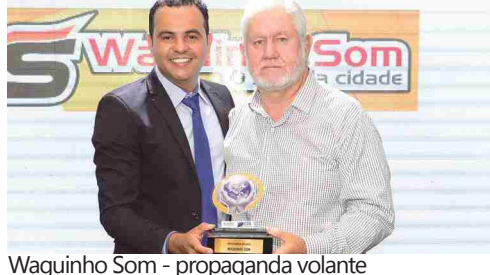
Waginha Som - propaganda volante