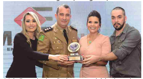
Maia Engenharia e Projetos - escritório de projetos de engenharia civil