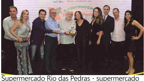
Supermercado Rio das Pedras - supermercado