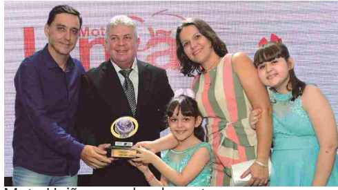
Moto União - vendas de motos