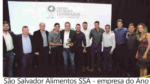
São Salvador Alimentos SSA - empresa do Ano