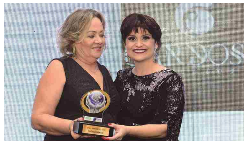
Cardoso Eventos - espaço para eventos e festas