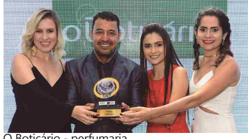
O Boticário - perfumaria