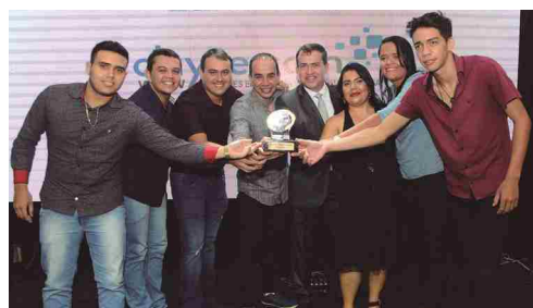
Clayte.Com - assistência técnica em informática