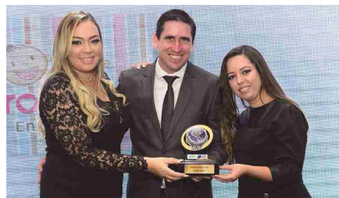
Carol Baby - enxovais e roupas para bebês