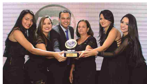
ACB Info Tecnologia - provedor de Internet