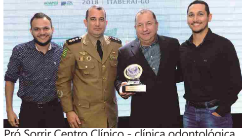
Pró Sorrir Centro Clínico - clínica odontológica