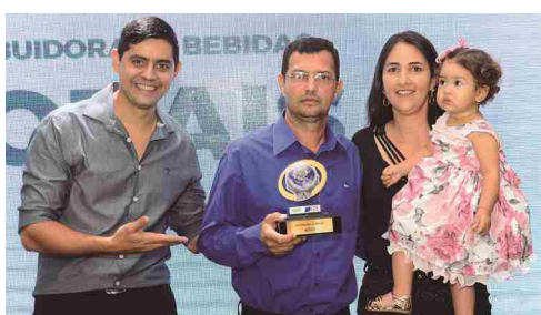
Distribuidora de Bebidas Morais - distribuidora de bebidas