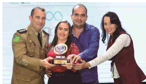
AMA Diagnóstico - centro clínico médico