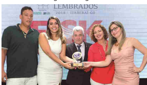
FSK - escola de idiomas