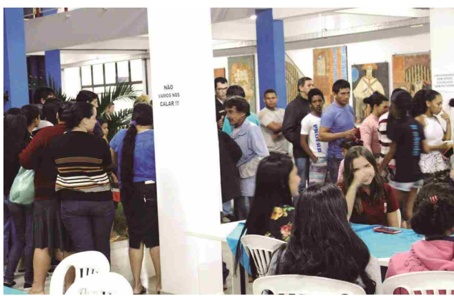
Cerca de 600 porções de sopa foram servidas nesta edição

Alunos do terceiro período do curso de Sistema de Informação da Universidade Estadual de Goiás (UEG), Campus de Itaberaí, realizaram a segunda edição do projeto "Sopa Solidária", com a proposta de trazer a comunidade local para dentro da universidade.