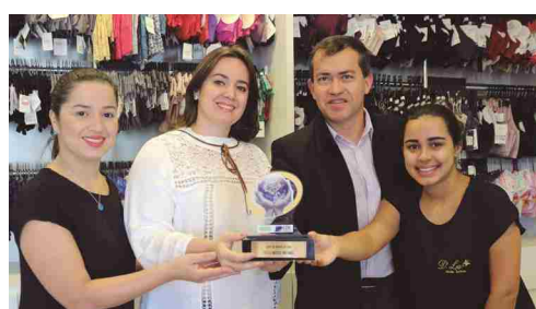
D'LU Moda íntima - loja de moda íntima