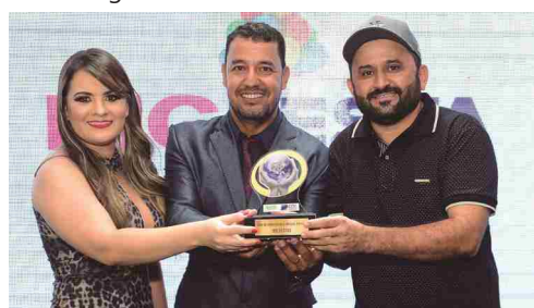
Big Festas - casa de embalagens e artigos p/ festas