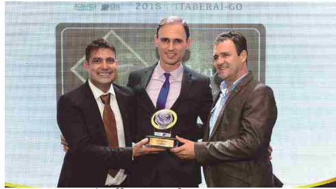
JG Eventos - buffet para festas