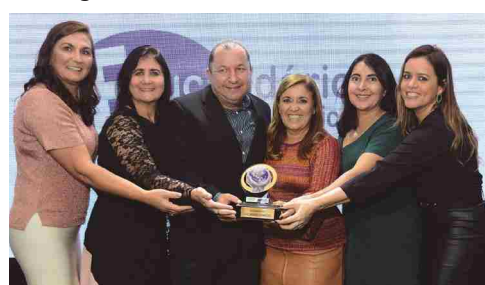
Educandário Evangélico - escola particular