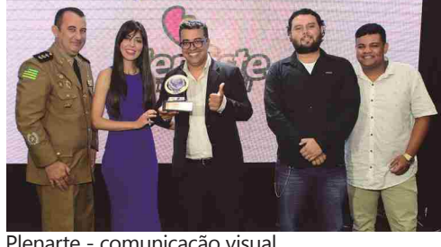
Plenarte - comunicação visual