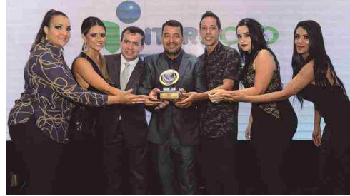
Interção Celulares Vivo e Renov - revenda de celulares