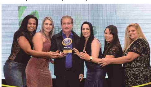
BIOLAB - laboratório de análises clínicas