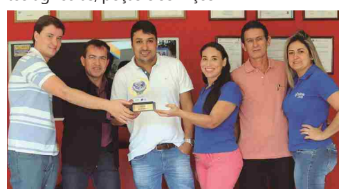
Colchões Ortobom - loja de colchões