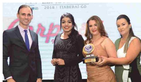
Corpus Moda Praia - loja de moda praia e aeróbica