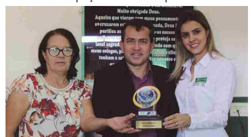
Posto Avenida - posto de combustível