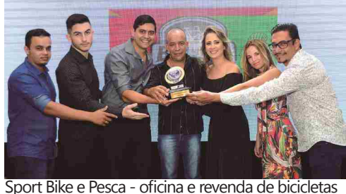
Sport Bike e Pesca - oficina e revenda de bicicletas