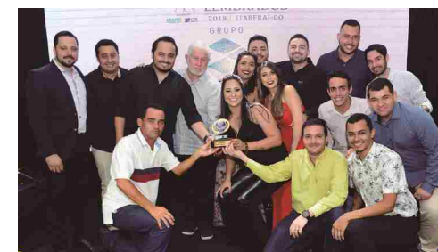
Grupo 3RN Empréstimos - crédito consignado