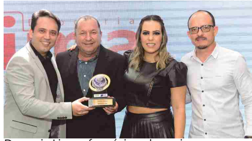
Drogaria Lima - farmácia e drogaria