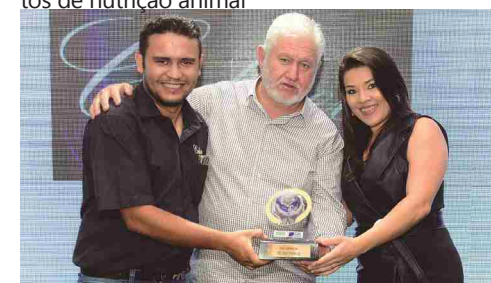
Coiseu Eventos Luz e Som Digital - som e iluminação