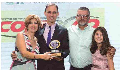
Auto Escola Conexão - auto escola