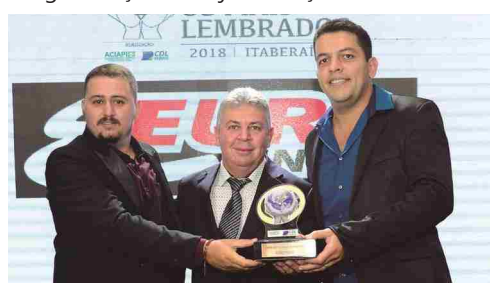
Euro Tintas - tintas automotivas e residenciais