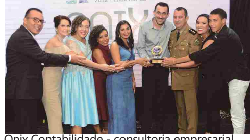
Onix Contabilidade - consultoria empresarial