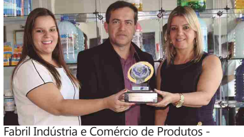
Fabril Indústria e Comércio de Produtos - produtos para limpeza e piscina