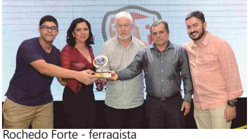
Rochedo Forte - ferragista