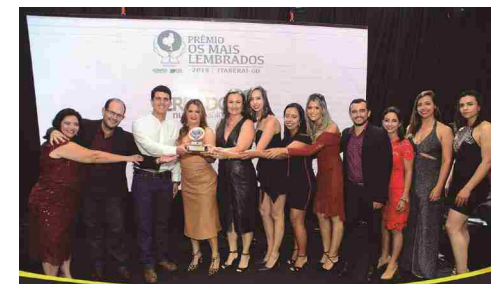
Cerrado Nutrição Animal - indústria de produtos de nutrição animal