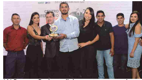
LN Pneus e Rodas - alinhamento automotivo e revenda de pneus