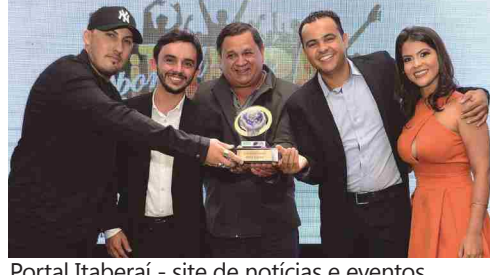
Portal Itaberai - site de notícias e eventos