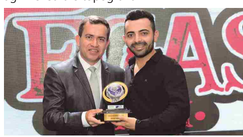
Vegas Ranch - loja de acessórios country