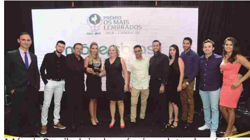
Móveis Brasil - loja de móveis e eletrodomésticos