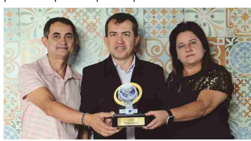
Pizzaria Colucci - pizzeria