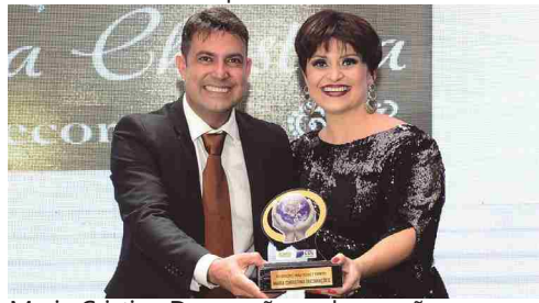
Maria Cristina Decorações - decorações para festas e eventos