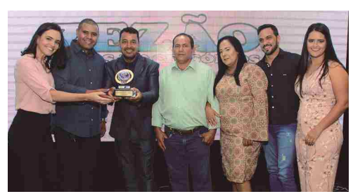
Zezão Pneus - peças e acessórios para caminhões