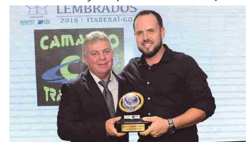
Camarão Transportes - transp. mercadorias e encomendas