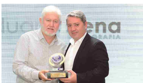
Eduardo Sena Fotografia - fotógrafo adulto e infantil