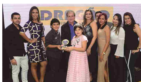
Dragão Calçados - loja de calçados masculino