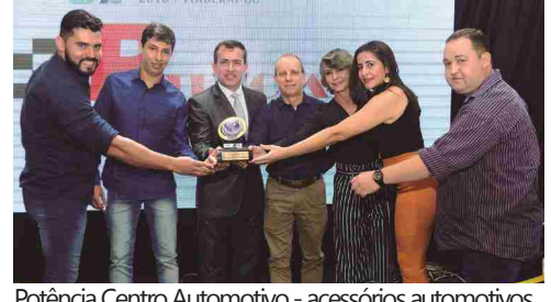
Potência Centro Automotivo - acessórios automotivos