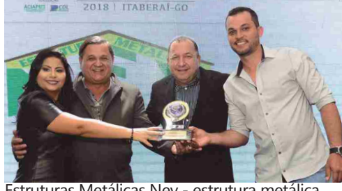
Estruturas Metálicas Ney - estrutura metálica