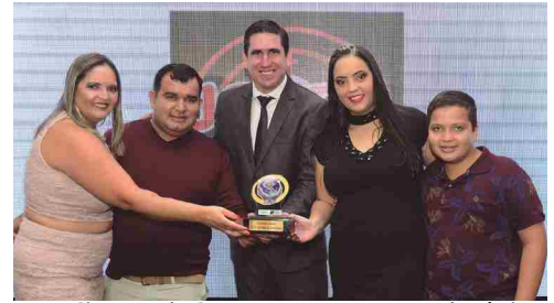
Jotec Sistema de Segurança - segurança eletrônica