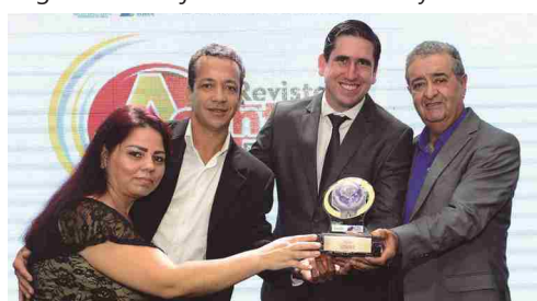
Revista Acontece - revista impressa