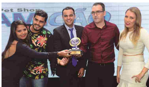
Pet Shop Amicão - pet shop