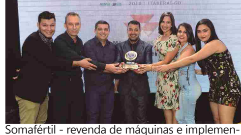
Somafertil - revenda de máquinas e implementos agrícolas, peças e serviços