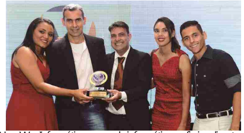
NewWay Informática - curso de informática profissionalizante