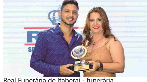
Real Funerária de Itaberai - funerária