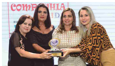
Companhia Kids - loja de roupa infantil