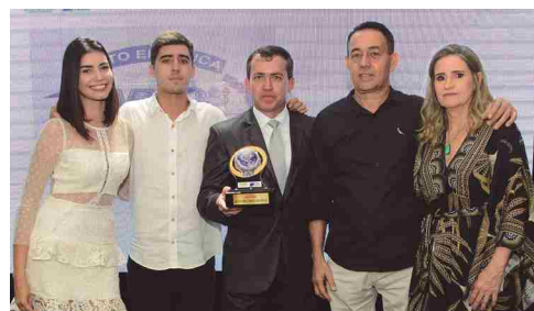
Auto Elétrica Carlos - auto elétrica