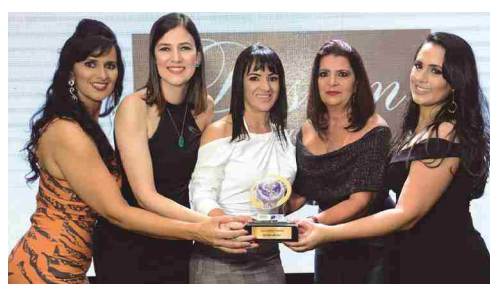
Design Modas - loja de roupas feminina