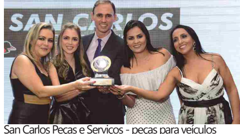
San Carlos Peças e Serviços - peças para veículos