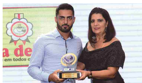
Café Boca de Pito - marca de café em Itaberaí