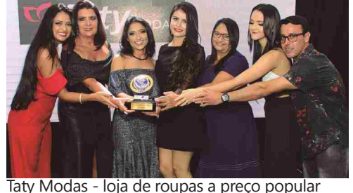
Taty Modas - loja de roupas a preço popular