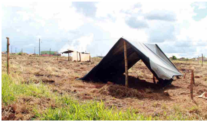
No início da tarde da quarta-feira havia pouco movimento no local

Um grupo de moradores da região invadiu nova área na região do setor Itavilly na última terça-feira (24/04). A ocupação se deu forma tranquila, segundo moradores da região. No início da tarde da última quarta-feira nossa equipe esteve no local e encontrou pouco movimento na área. Moradores que