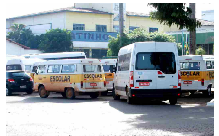
Transporte Escolar ficou parado por dois dias

atravessam, em especial pela falta de repasse estadual referente a todo o segundo semestre de 2018. Vale ressaltar que, mesmo com seis meses sem receber o repasse estadual, a gestão municipal efetuou o pagamento de todos os meses, sempre privando pelos alunos e também pelas empresas contratadas. Lamentamos a paralisação repentina e principalmente a forma que foi conduzida, sem ao menos informar às famílias, o que ocasionou um grande transtorno a todos os usuários, que se prepararam para ir às aulas, a maioria se deslocaram para o ponto e, sem nenhuma