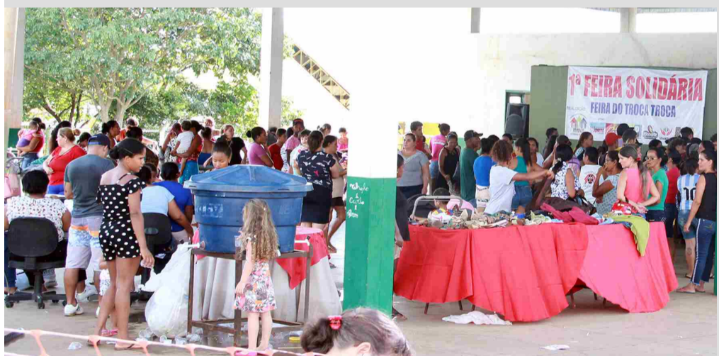
Primeira edição da Feira Solidária movimentou o Terminal do Trabalhador durante todo o dia

A Associação de Moradores do Bairro Fernanda Park (Amfepark), realizou a "Primeira Feira Solidária" a troca de bens e produtos como roupas, calçados, guarda-roupas, celulares, cadeir-