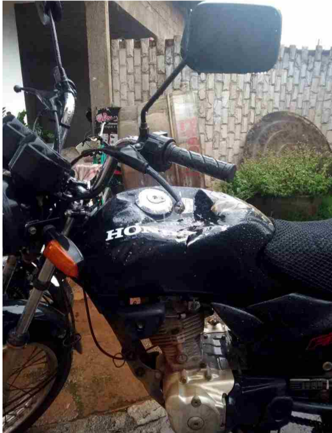
Estragos sugerem que marginal se acidentou durante fuga pela 070

Os casos estão sendo investigados pela Polícia Civil.