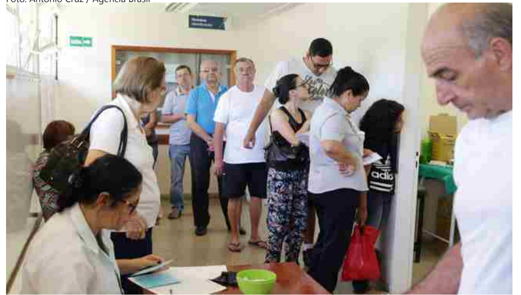
Início foi antecipado em 15 dias em quase todos os estados

No Amazonas, a vacinação contra a gripe começou no fim de março, com antecipação de 21 dias em relação às demais unidades federativas. A decisão, segundo a pasta, se deu em função da ocorrência de casos e óbitos por influenza desde fevereiro deste ano. Em todo o ano de 2018, o Amazonas registrou 17 casos e três mortes por influenza, sendo um caso pelo vírus H1N1. Até meados de março deste ano, já foram notificados 666 casos suspeitos, sendo 107 confirmados para H1N1, além