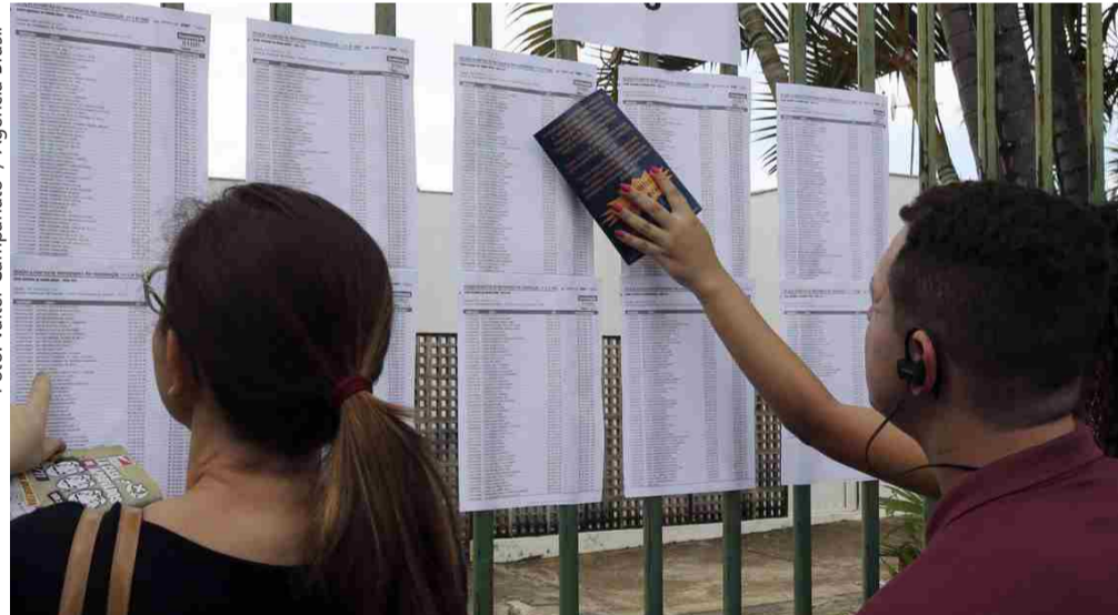
Notas do Enem podem ser usadas para o Sisu, ProUni e Fies

Quase 2,2 milhões de estudantes haviam solicitado a isenção da taxa de inscrição do Exame Nacional do Ensino Médio (Enem) 2019, de acordo como Instituto Nacional