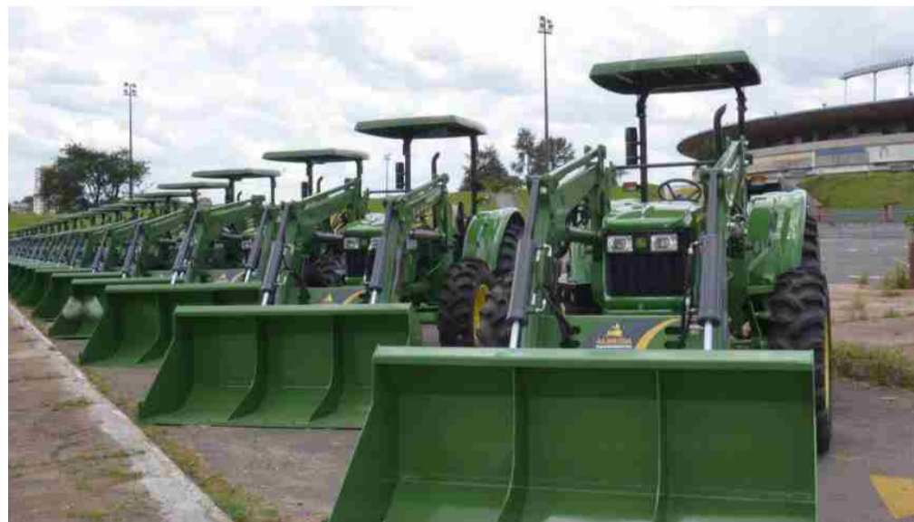
Parte do maquinário está no estacionamento do Estádio Serra Dourada e na antiga Agetop

Na região, além de Itaberaí, as prefeituras beneficiadas são: Aruanã – um caminhão basculante; Avelinópolis – uma retroescavadeira e um caminhão basculante; Caturai – uma retroescavadeira; Faina – um caminhão basculante; Goiás – uma motoniveladora, uma retroescavadeira, dois caminhões basculante e um trator agrícola com plaina; Heitorai – um caminhão basculante; Inhumas – uma motoniveladora, uma retroescavadeira e um caminhão basculante; Itaguarí – dois caminhões basculante; Itapirapuã – um