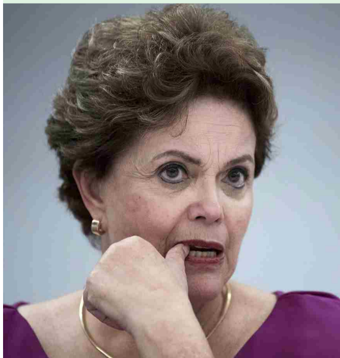
Dilma Rousseff: de favorita a rejeitada pelos mineiros

Nas eleições de 2018, dos 26 estados, mais o Distrito Federal, o Mato Grosso aparece com o maior índice de abstenção, com 24,6%. Isso significa que 1 em cada 4 eleitores aptos deixou de votar. Na direção oposta, o estado com o menor número de abstenções foi Roraima, com 13,9%.