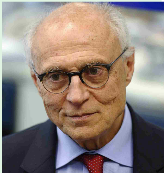
Eduardo Suplicy foi duramente reprovado pelos paulistas