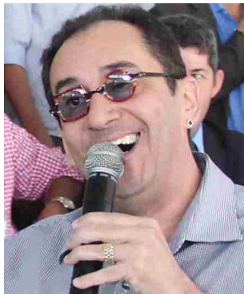
Kajuru ficou com a segunda vaga para o Senado