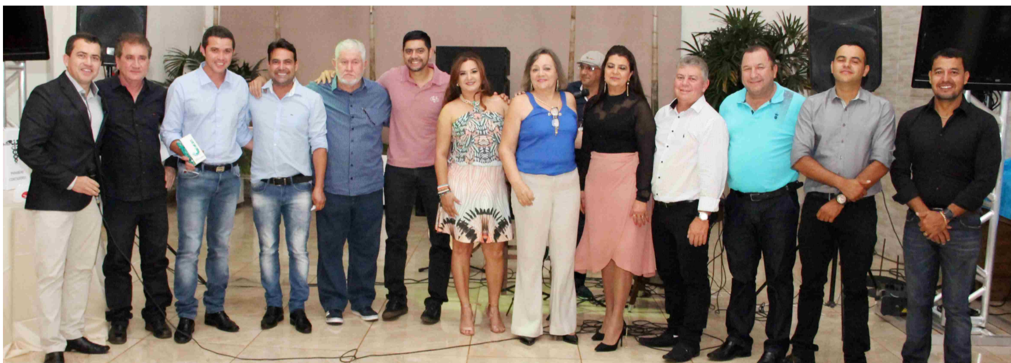
Diretoria da ACIAPI-CDL promove segundo encontro de contadores na cidade de Itaberá