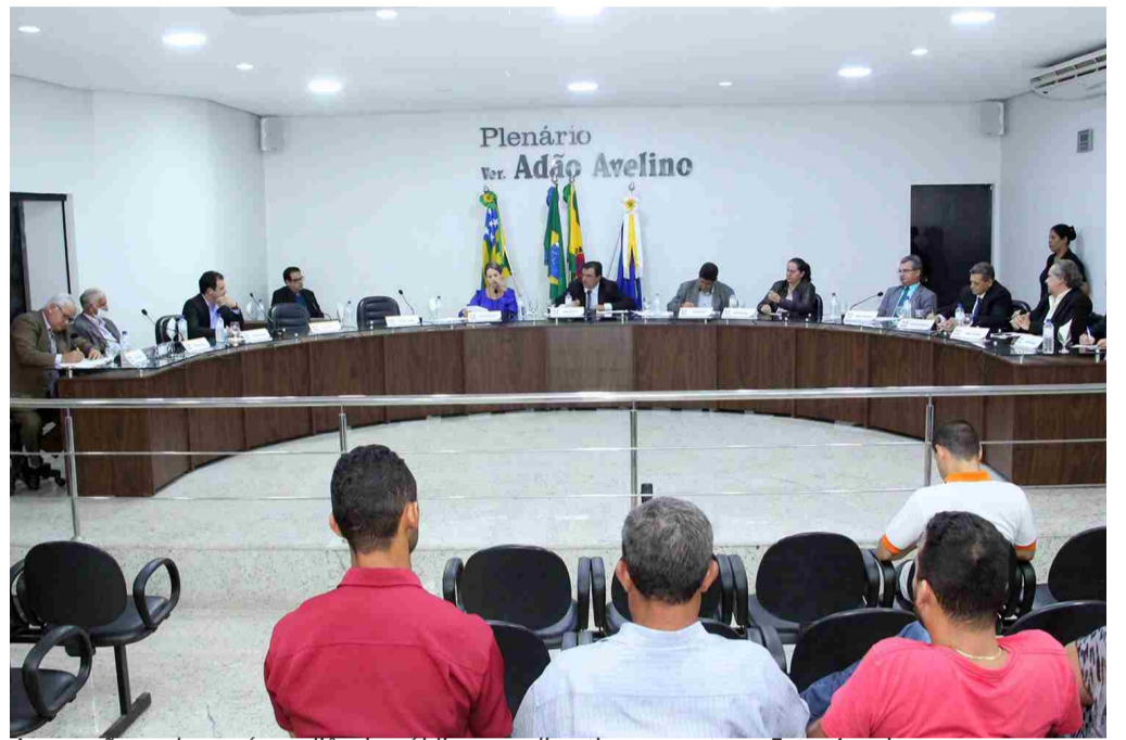
Aprovação se deu após audiência pública que discutiu o assunto