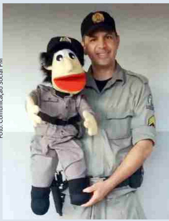
Stive é boneco que ajuda a PM a desenvolver projeto com crianças