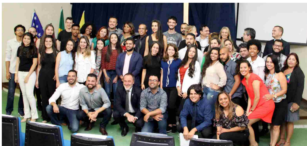
Alunos da primeira turma de Direito do Campus Aparecida de Goiânia da Universidade Estadual de Goiás