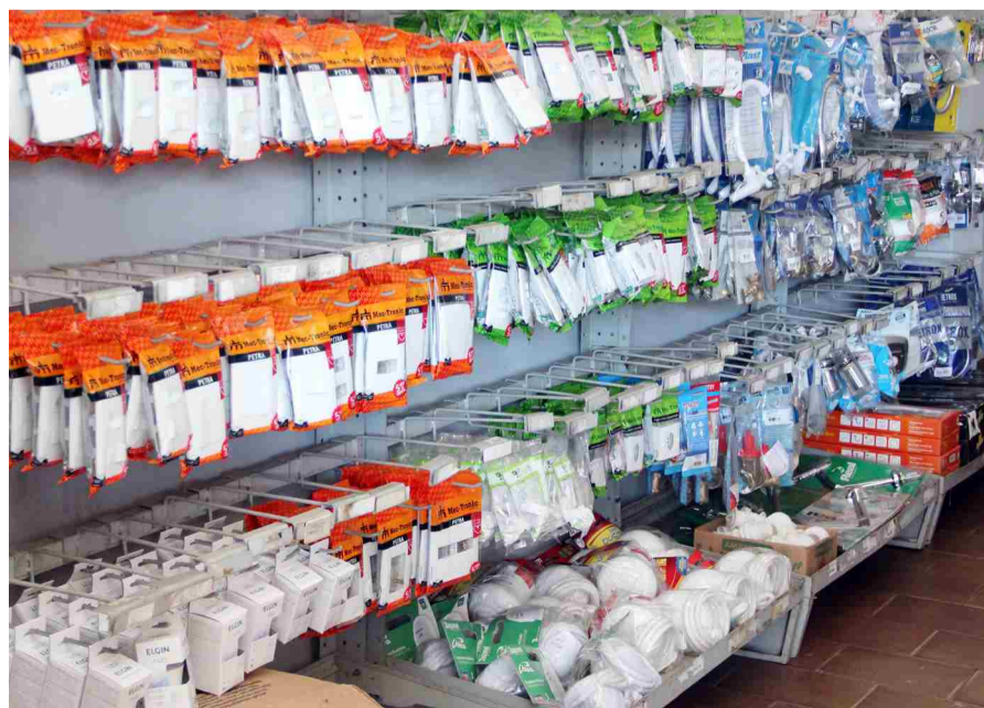
Linha de produtos diversificada para atender o consumidor residencial e lojistas