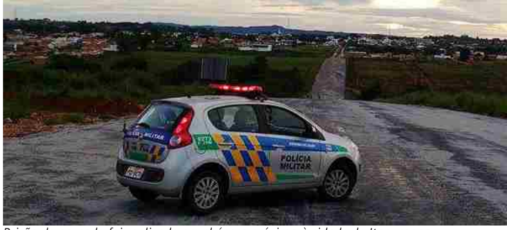
Prisão de acusado foi realizada em chácara próxima à cidade de Itapuranga

conseguiu se desvencilhar do agressor e correr para o interior de sua casa trancando a porta e pedir socorro, frustrando o autor, que evadiu em sentido ignorado. De posse das características do acusado, a equipe realizou patrulhamento por toda região, conseguindo localizar e efetuar a prisão do acusado em uma chácara às margens da GO-230, já há alguns quilômetros de Itapuranga. As informações são do subtenente Cunha, do departamento de Comunicação Social da 2ª Cia 6º BPM/4º CRPM.