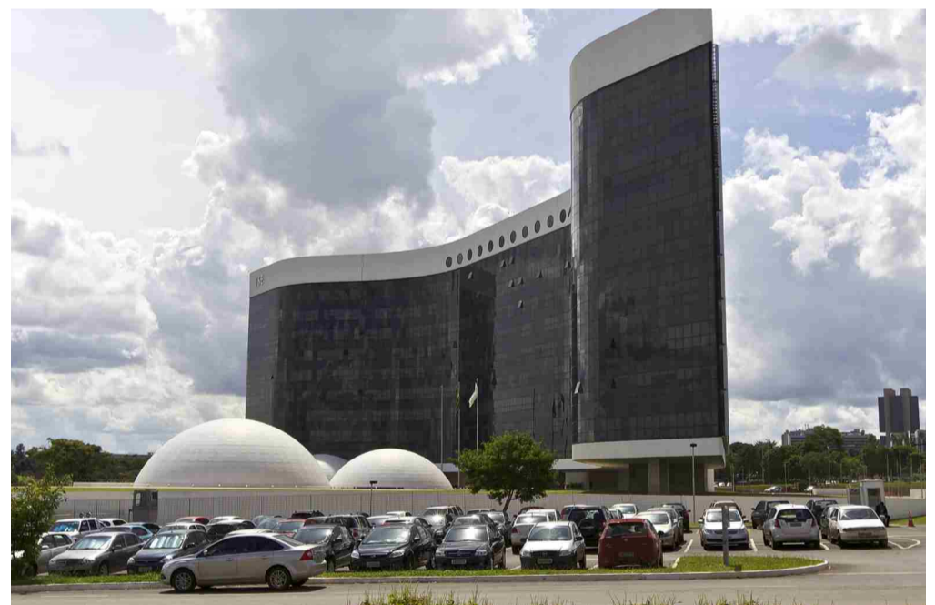
Sede do Tribunal Superior Eleitoral em Brasília (DF) onde são decididas as questões eleitorais

Geraldo Alckmin Relator dos pedidos de registro de Geraldo Alckmin (PSDB) e Ana Amélia (PP), o ministro