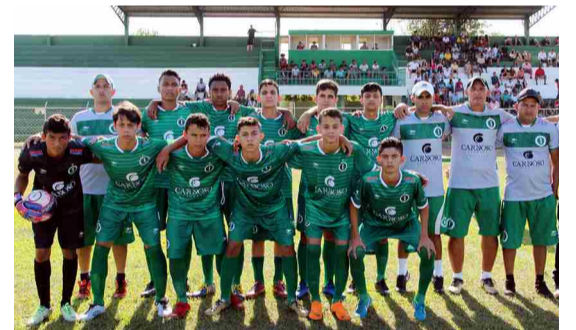
Equipe Sub-15 estreou no sábado com casa cheia