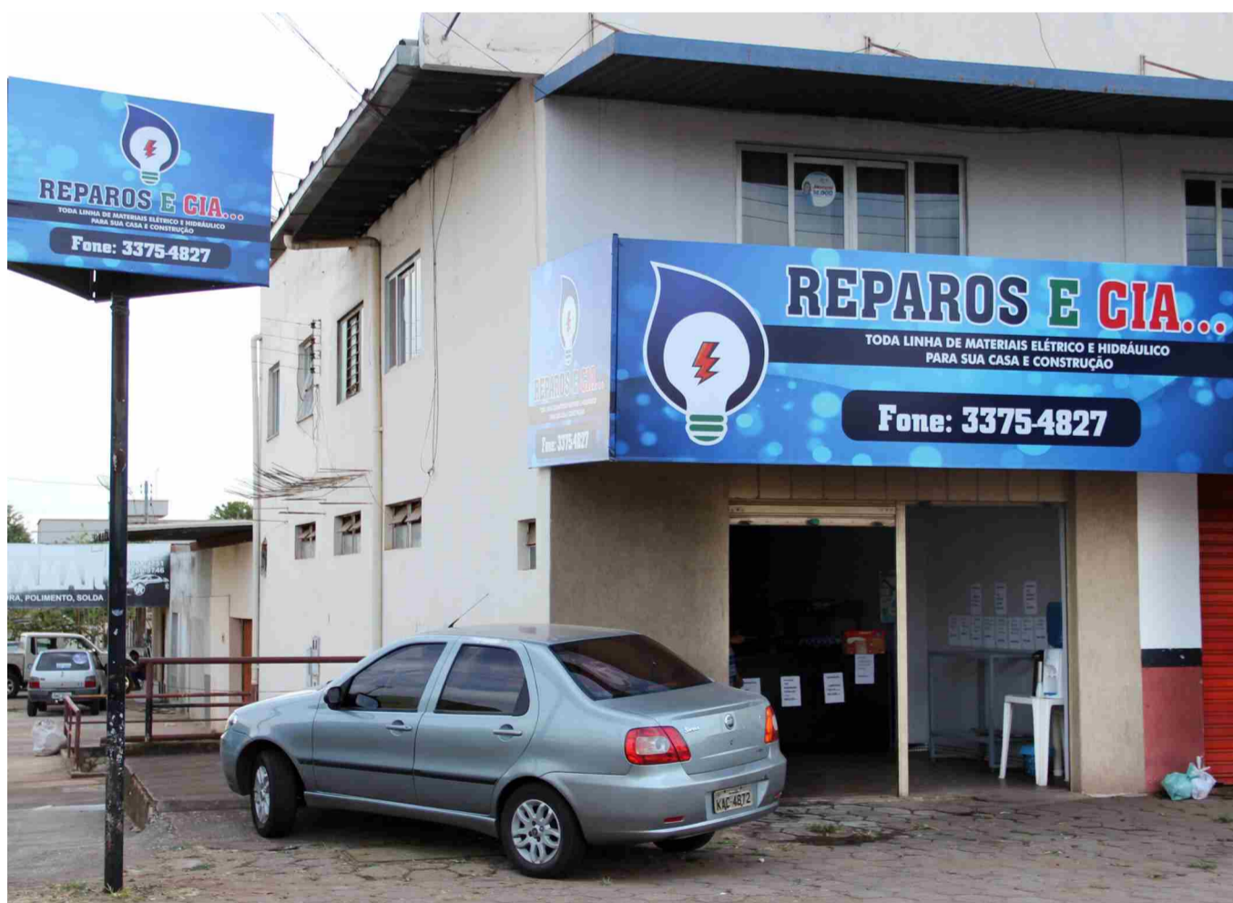
A Reparos e Cia está localizada na Avenida Goiás, Quadra 41, Lote 16b

"A cidade vem crescendo nos últimos anos e nossa expectativa é crescer e colaborar com o crescimento da cidade. Nosso forte não é fazer promoções, mas vender barato todos os dias", finalizou o empresário.