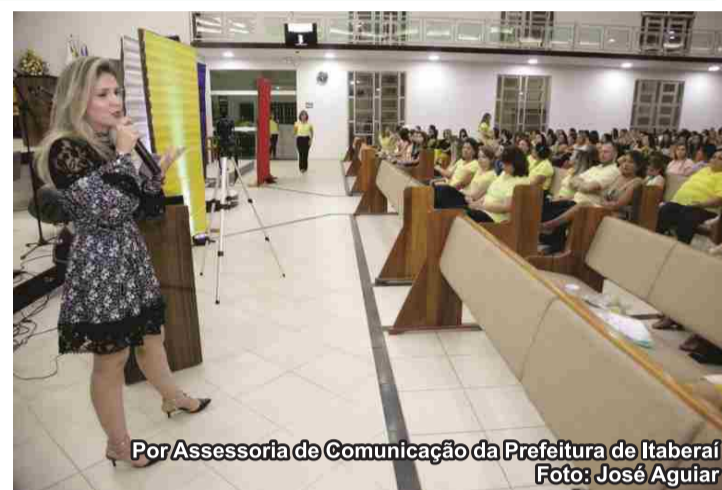
Por Assessoria de Comunicação da Prefeitura de Itaberaí

No final do evento foi servido um coffee break a todos os presentes.