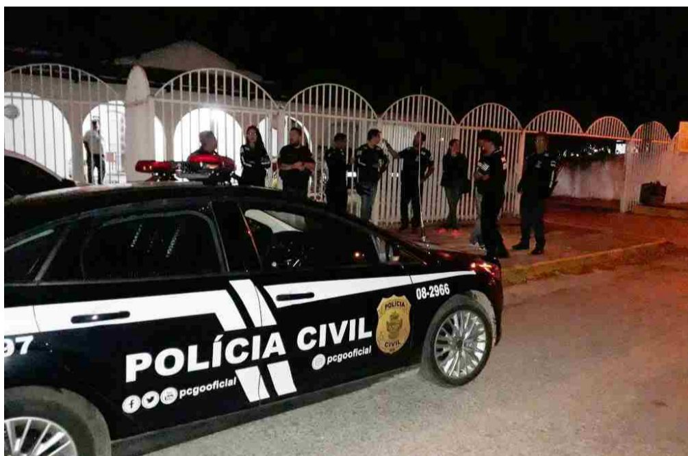
Policiais civis foram responsáveis pela Operação Festa do Povo em Itaberaí

A Delegacia de Polícia Civil de Itaberaí, juntamente com o Grupo de Repressão ao Narcotráfico (GENARC) da Cidade de Goiás, deflagrou a operação Festa do Povo, na qual foram cumpridos dez mandados de busca e apreensão domiciliar em diversos pontos da cidade, resultando na apreensão de drogas e de uma arma de fogo. A operação contou com o apoio de cerca de quarenta policiais civis das cidades que compõem a 4ª DRP e com equipes da DENARC