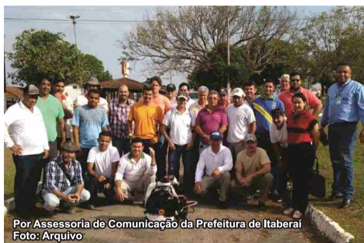
Por Assessoria de Comunicação da Prefeitura de Itaberaí

Nos dias 07, 08 e 09 de agosto, foi realizada na Sede da Regional Rio Vermelho, na Cidade de Goiás, uma capacitação a nível estadual para todos os municípios agregados a regional, referente às ações pertinentes ao Núcleo de Controle de Vetores (NCV).