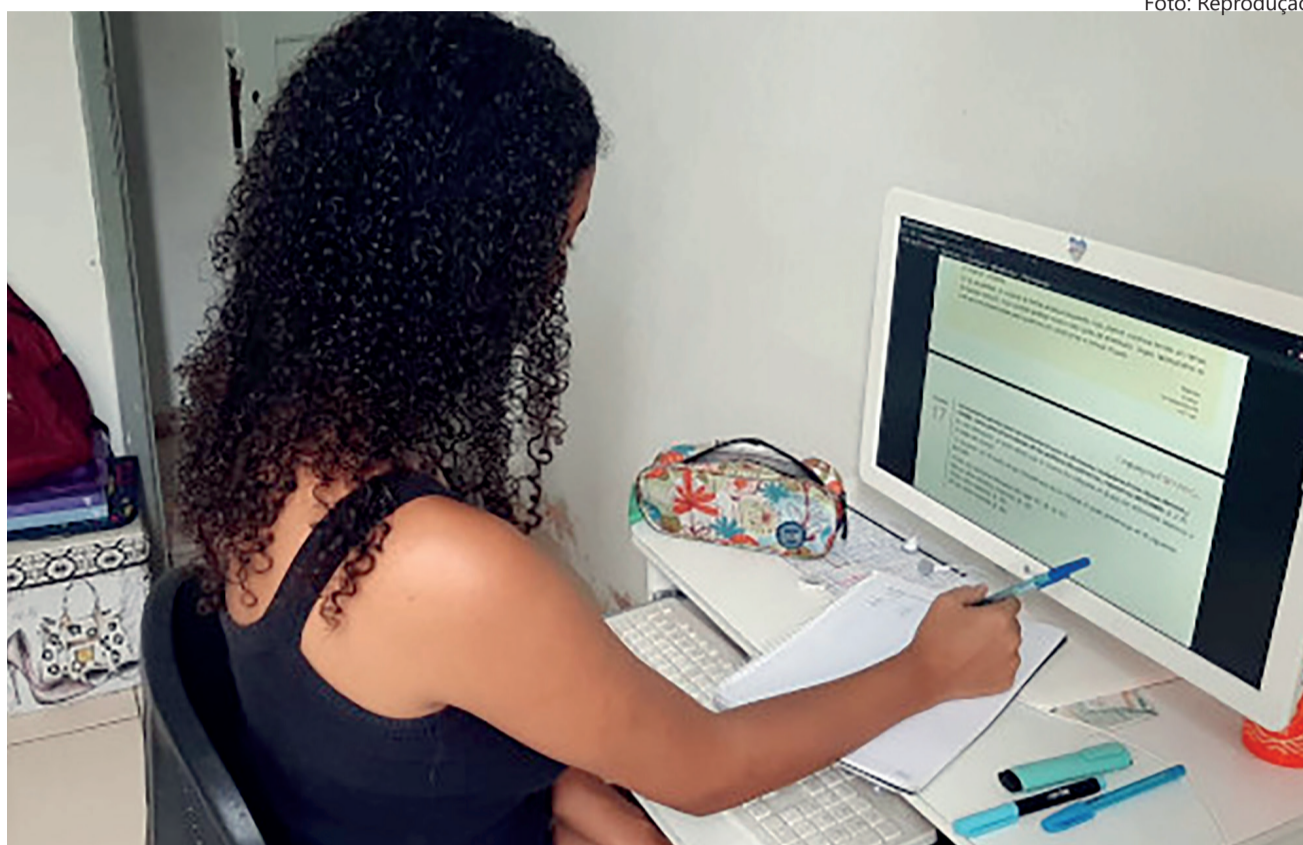
A rotina dos estudantes fora da sala de aula é solitária e requer disciplina

No início da noite da quarta-feira a Secretaria de Estado de Saúde de Goiás publicou nota informando que decidiu por manter suspensas as aulas presenciais no estado. A medida deve vigorar pelo menos até o final de setembro.