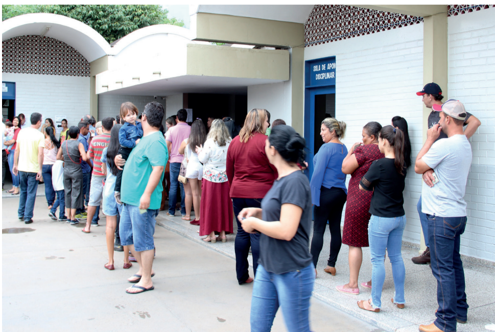
Medidas do TSE visam evitar fila como esta registrada nas eleições de 2018 no Colégio Militar Maria Helyny Perillo

As eleições deste ano para a escolha de prefeitos e vereadores terão várias mudanças em relação aos pleitos anteriores. Há mudanças no sistema de candidaturas para vereadores e novas ações da Justiça Eleitoral para evitar proliferação de fake news (notícias falsas). A pandemia do coronavírus também impôs uma série de ações, em especial, a mudança do calendário eleitoral.