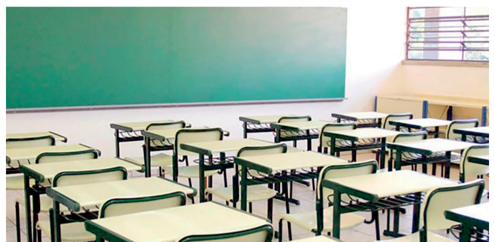
Escolas vão permanecer com salas vazias pelo menos até final de setembro

Por fim, a SES-GO ressalta que o COE reúne representantes de diversas instituições e tem caráter consultivo e deliberativo. O grupo trabalha para estreitar, cada vez mais, as relações entre saúde e educação, com o intuito de uma retomada das aulas de forma segura e responsável para todos", diz a nota.