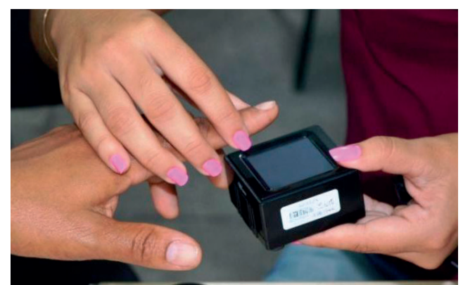
Identificação biométrica não será usada nas eleições municipais de 2020

O eleitor deve levar o título e um documento com foto. Por causa da pandemia do novo coronavírus, a Justiça Eleitoral descartou a utilização de dados biométricos, pois a superfície do equipamento que identifica as digitais não pode ser higienizado com frequência. Também haveria mais filas e aglomerações, pois o sistema de biometria é mais demorado do que o de assinaturas.