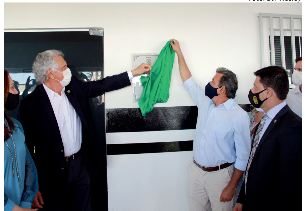
Grupos especializados vão atender 28 municípios da 4ª Delegacia Regional de Segurança Pública