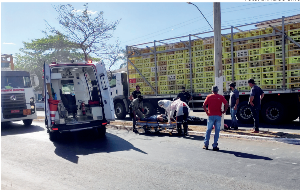
Vítima é atendida por profissionais do Samu e da Polícia Militar

Acidente ocorrido na quarta-feira (20) na Avenida Goiás com a Rua Augusto Bailão, envolvendo um caminhão e uma motocicleta, deixou o trânsito