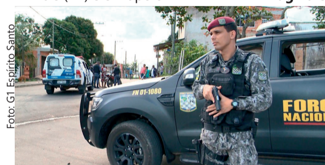
Força Nacional de Segurança Pública reforça segurança nos estados