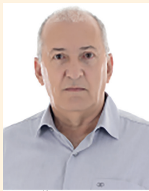
Por Nilton Luz Colunista Correio Popular e Revista Acontece

ele Zé. Se você conseguir te dou uma caixa de cerveja e se você não conseguir me dá uma, fechado? - Fechado! No dia seguinte na hora do almoço, lá foi o Zé para a casa do vigário, e seu amigo ficou sentado no banco da praça aguardando o resultado. Toc, toc, toc na porta e lá de dentro o vigário pergunta: - Quem é? - É o Zé da Tonha, seu Vigário. O Vigário abre a porta e pergunta: O que aconteceu? E que você quer a essa hora? Não está vendo que estou ocupado? - Sabe o que é seu Vigário, eu só queria saber do senhor o quanto vale uma pedra de diamante desse tamanho? Disse o Zé mostrando com os dedos o tamanho da pedra. - Deixa eu ver ela Zé, disse o Vigário. E o Zé na maior cara de pau: - Eu quero só saber. Porque quando eu achar, já sei o quanto vale. O Vigário decepcionado por ter sido feito de besta, diz para o Zé, ponha se daqui para fora, já!