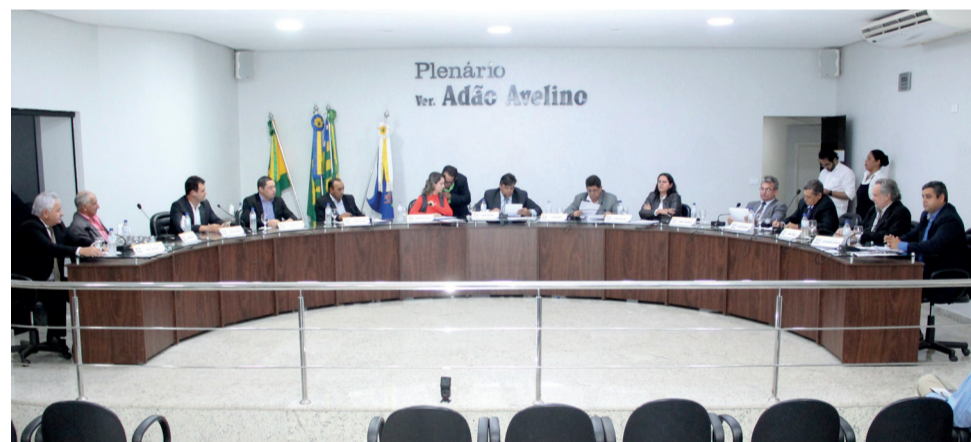
Câmara Municipal de Itaberaí é formada por 13 vereadores

Em Itaberaí estima-se que entre 120 e 160 candidatos vão disputar as 13 vagas de vereadores.